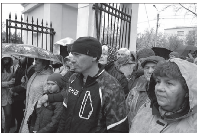
Народ в ожидании