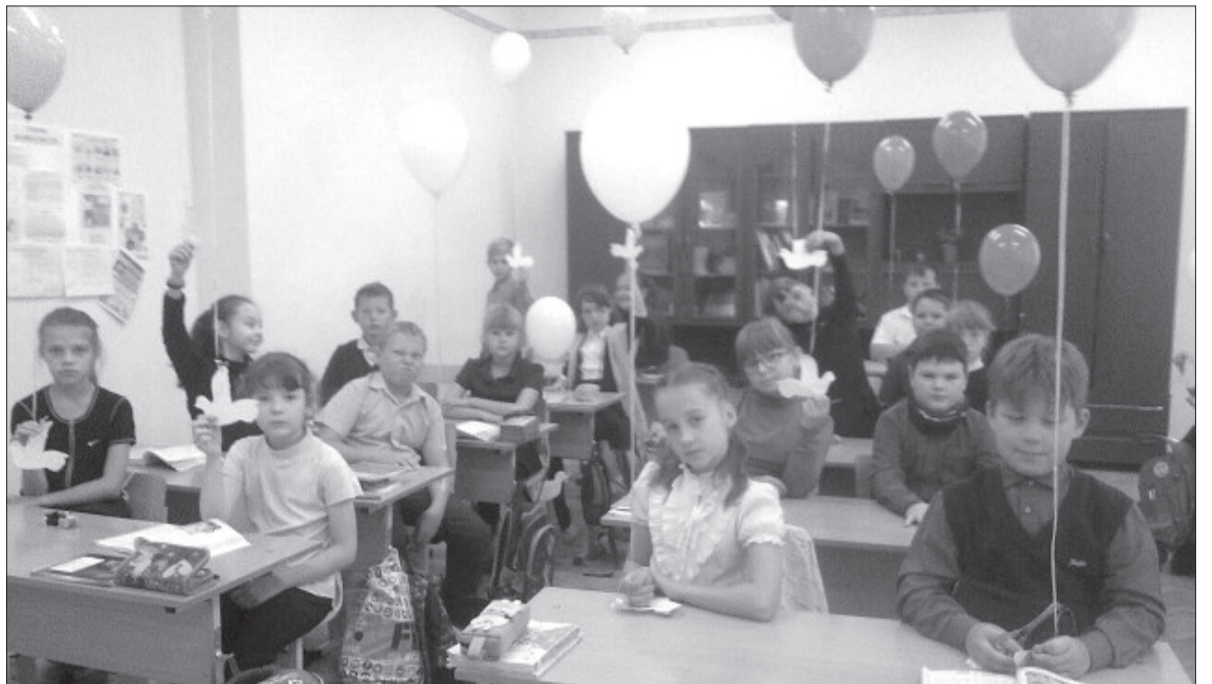
Учащиеся школы приняли участие в акции Голубь мира