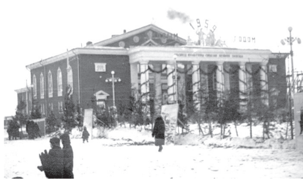
Дворец культуры 1-го Мая

Давно хотелось пройти по тропам юности своей вдоль берега пруда, да все как-то не получалось... И все-таки собралась. Поход этот, скажу не тая, разбередил душу. В быв-