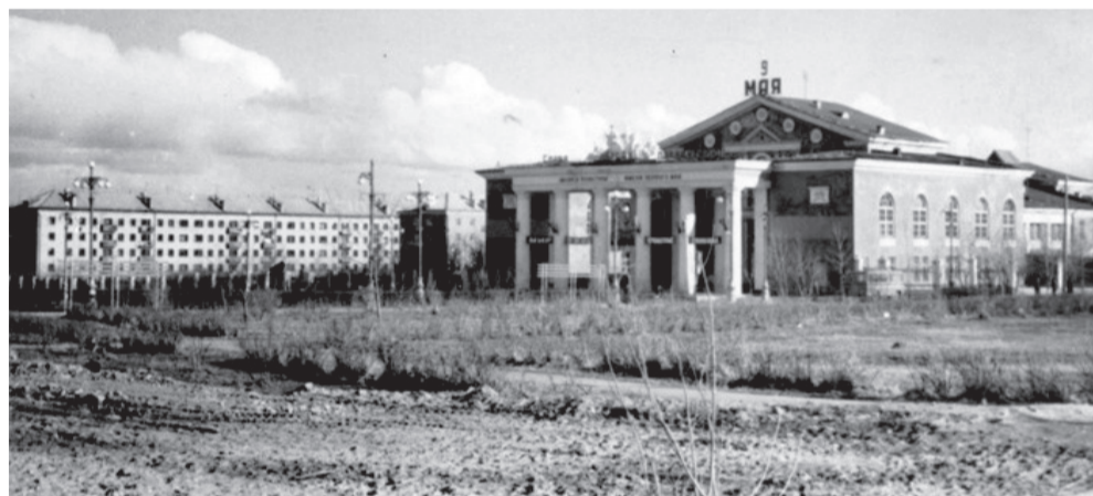
Дворец культуры 1-го Мая