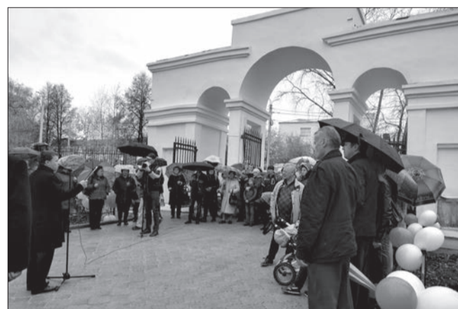
Двери Парка открыты!