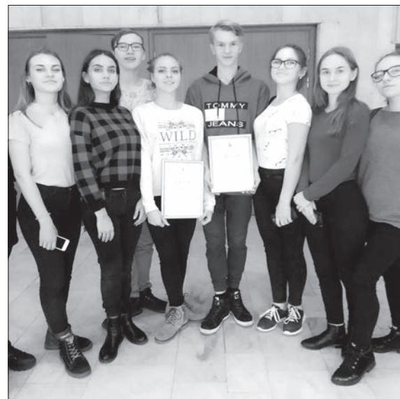
Россияночка в Москве и уже с Дипломами