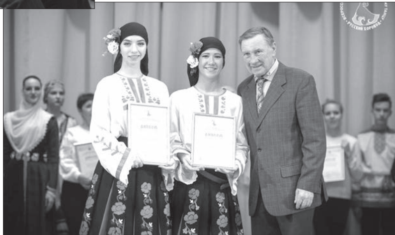
На Большой сцене награждается Остров танцев

С 1 по 4 ноября 2018 года в Москве состоялся Всероссийский конкурс по народному танцу «Русский хоревод». Конкурс организован в юбилейный год, в год 100-летия Государственного академического хореографического ансамбля «Берёзка» им. Н. С. Надеждиной с целью отдать дань уважения всемирно известному коллективу, покорившему сердца