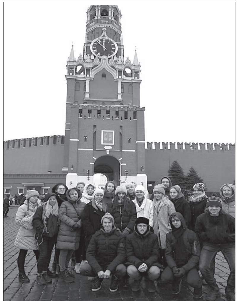
Россияночка в Москве

Вот такой урожайный ноябрь! На этом наши дипломанты и лауреаты не остановились. У них снова идут репетиции и подготовка к очередным фестивалям и конкурсам.