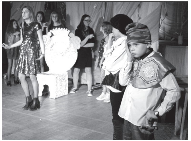
Театральная студия Коломбина