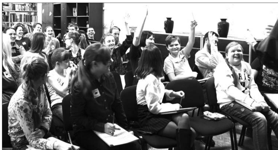
Участники игры собрались в детской библиотеке Верхней Салды

ЛАБА – это международная просветительская акция для всей семьи. Тест-игра позволяет вспомнить и понять, откуда произошел человек, как устроен окружающий мир и как работают технологии. Участников, которые отвечают на вопросы, здесь называют «лаборанты». Свои ответы они вносят в специальные бланки. Ведущий – завлаб оглашает правильные ответы, подробно разбирает задания и отвечает на вопросы.