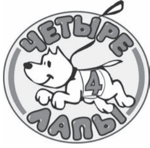
Фото ПАРАД любимцев "СОБАКА ГОДА" Спонсор МАГАЗИН "Четыре лапы" г. Н. Салда ул. Ломоносова, 19 ЗДЕСЬ ЕСТЬ ВСЁ - ДЛЯ НАШИХ ЛЮБИМЦЕВ!

г.Верхняя Салда, ул.Энгельса, Дом 81, корпус 4 тел. 8 900 200 09 45