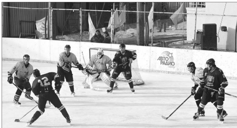
Фрагмент матча «Маяк-Гранит» - «Титан»