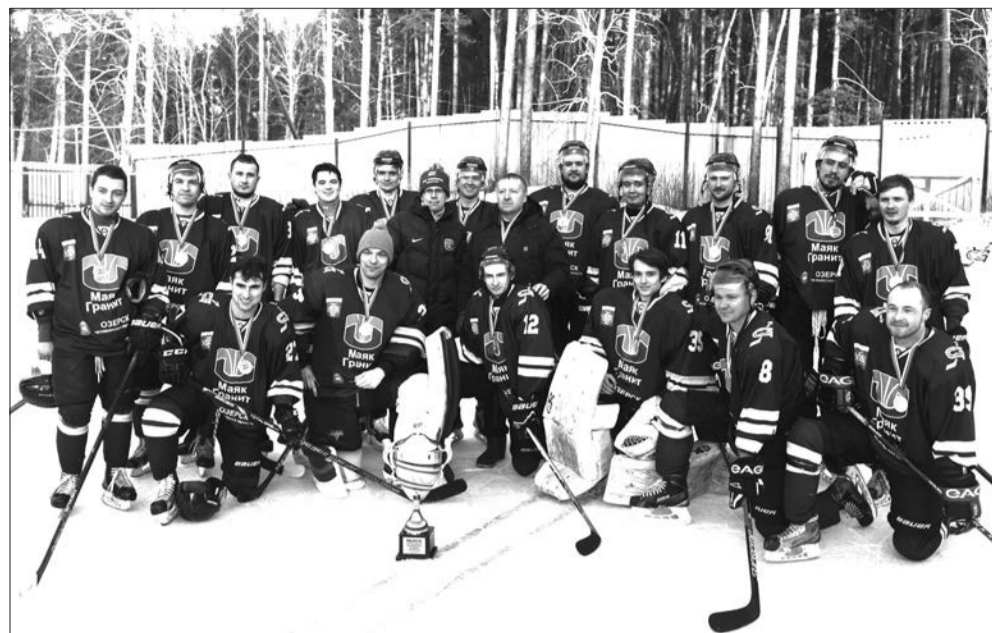
Команда «Маяк-Гранит» с наградами Открытого Первенства Свердловской области

Верхнесалдинские хоккеисты мужской команды «Титан» провели очередные матчи в Открытом Первенстве Свердловской области по хоккею. Их результаты оказались печальными.