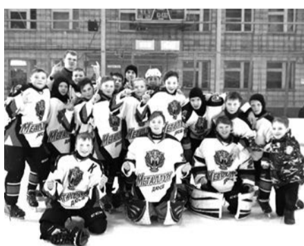
Команда «Металлург» 2005-2006 г.р. после победного финального матча

Дмитров в конце марта. Поздравим ребят с заслуженной победой на областном уровне и пожелаем им дальнейших успехов и побед!