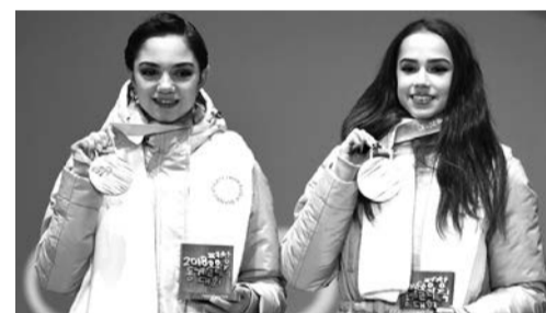
Фигуристки Е. Медведева (серебряная медаль) и А. Загитова (золотая медаль)