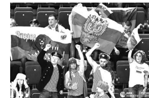
Форма без флага не помешала нашим болельщикам поддерживать наших спортсменов с триколором