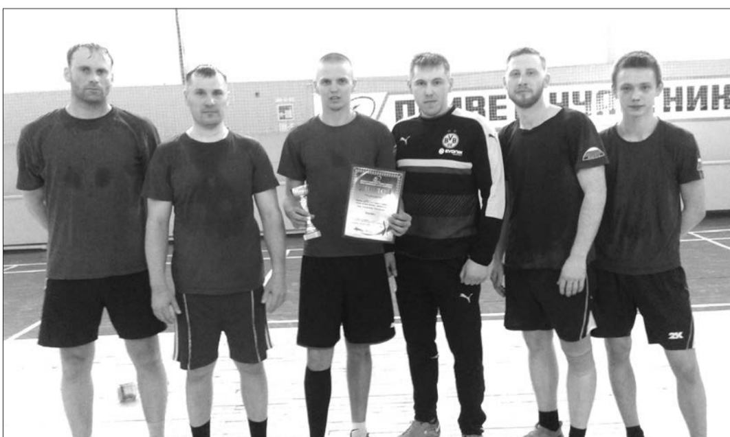
Команда МЧС - 2 место