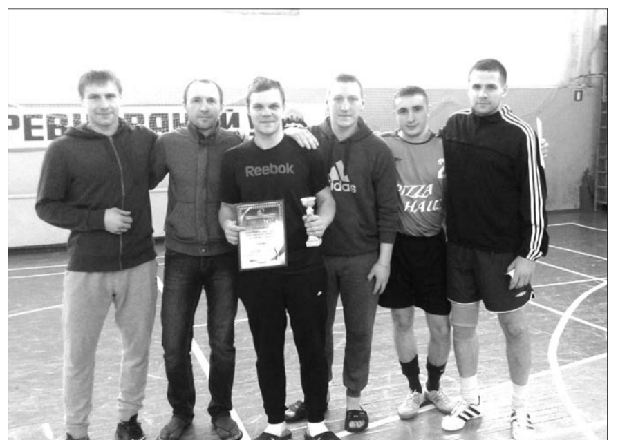
Команда Бордо - 3 место