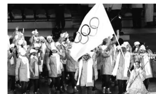
Сборная России на открытии и закрытии Олимпиады была вынуждена идти с Олимпийским флагом