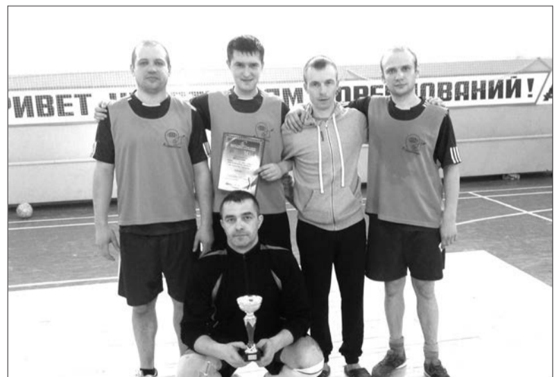
Команда НИИМаш - 1 место