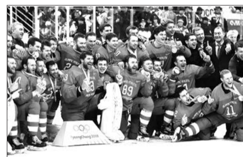
Сборная России с золотыми медалями