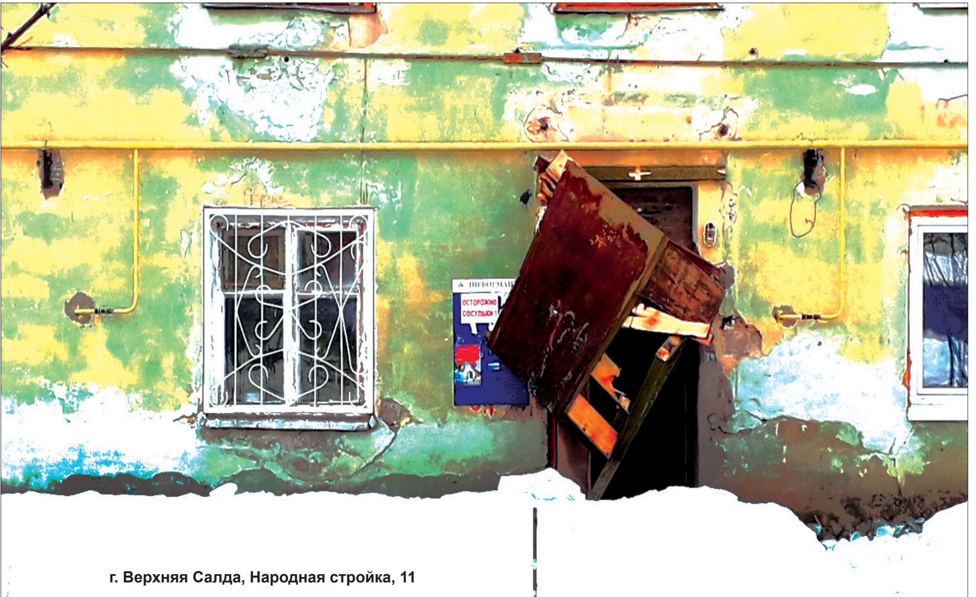
г. Верхняя Салда, Народная стройка, 11