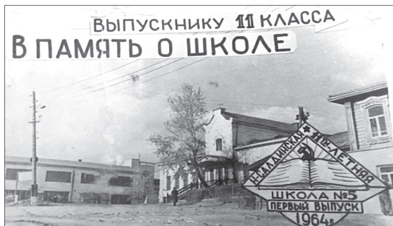
Школа № 5 1964 г.