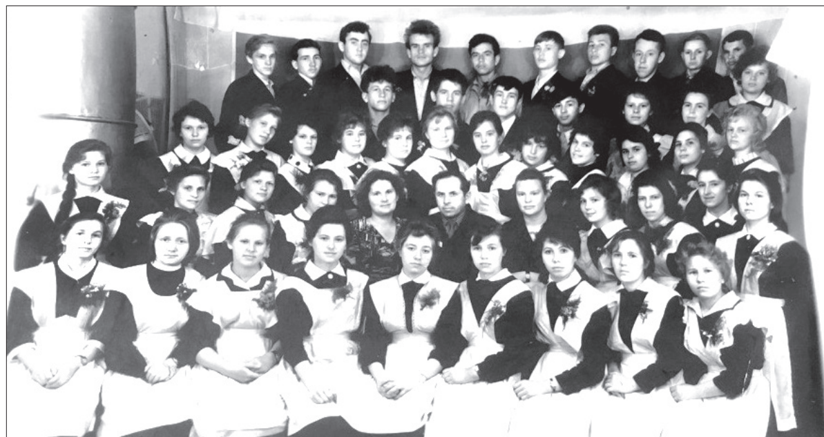
Выпуск 1964 года