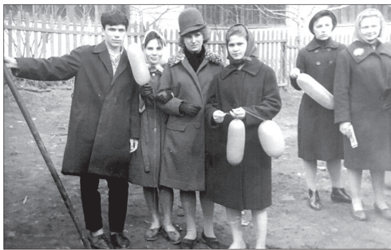
Учащиеся на демонстрации 1 Мая 1964 г.