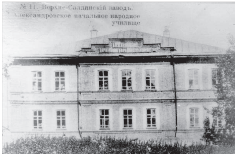
Здание Александровского начального народного училища

В 1897 году, в год приезда В.Е. Грум-Гржимайло в Верхнюю Салду, при Верхотурском земстве была