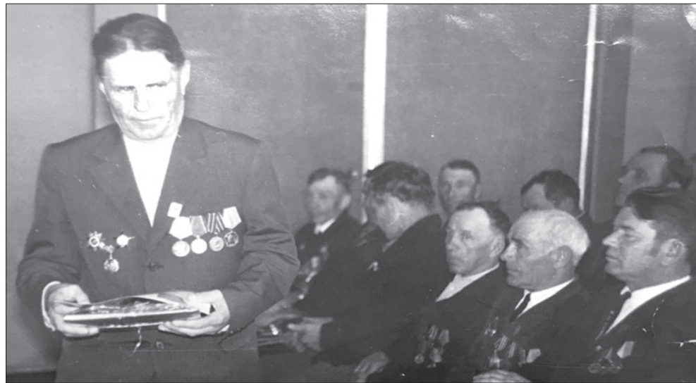
Чествуют фронтовиков НИИМаш. Примерно 1980-85 гг.

У нас на предприятии трудится немало участников Великой Отечественной войны. Почти каждый из воевавших, по словам маршала Жукова, лежал в промерзших окопах, случалось, что по многу дней не знал горячей пищи, много ночей не спал. Это было во время их молодости, тогда все казалось нипочем! А сегодня старая рана заговорила, здоровье шалит. Бывший солдат не станет вам жаловаться – не та закуска характера. А ведь некоторые из участников войны инвалиды. ЦК КПСС и Совет Министров СССР проявляет постоянную заботу об участниках войны. Им предоставлены льготы. В совместном решении администрации и профкома филиала (НИИМаш) от 16 января 1978 года говорится о предоставлении участникам войны ряда льгот. Многими из перечисленных в решении льготами фронтовики регулярно пользуются. К примеру,