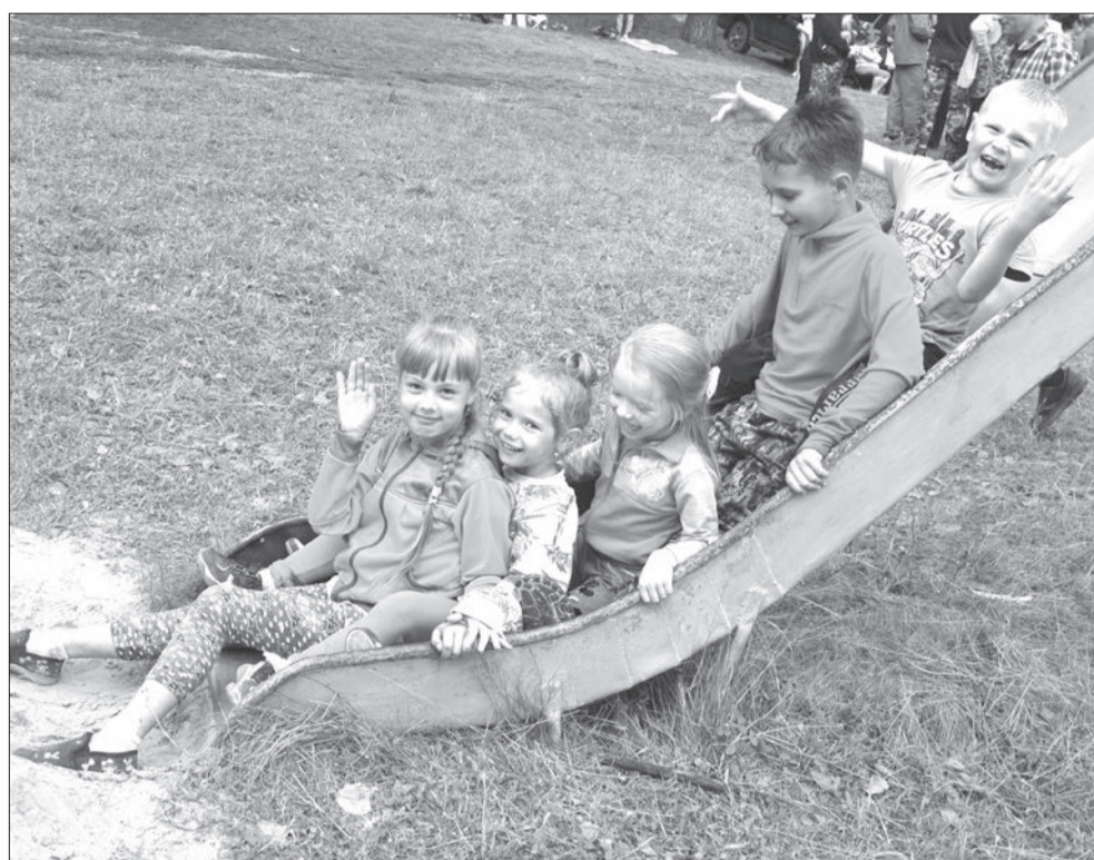
Весело у Третьей речки

А вот второй сюрприз был посложнее и напомнил чем-то телешоу Форт Боярд. Правда, в трех коробках лежали не жуки, змеи и скорпионы, а минералы и полудрагоценные камни, а вместо старца Фуры напротив угадывавших сидел инженер конструктор НИИмаш и КМС