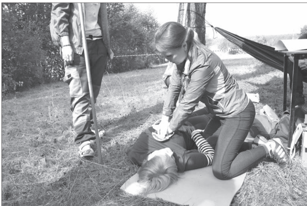
Я не волшебник - только учусь