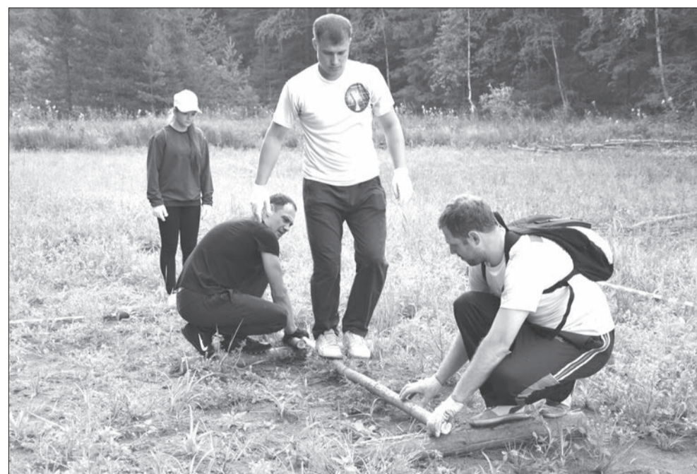
Они еще не знают, что победят