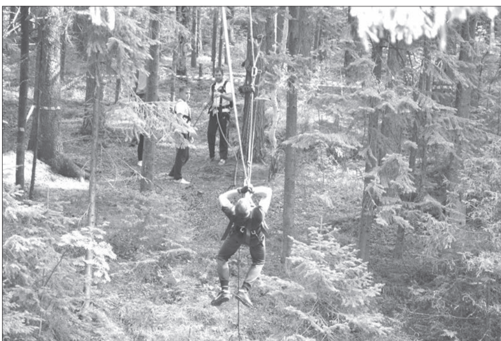
Переправу осилит самый цепкий