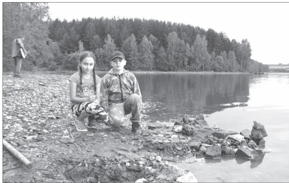
Пока барды распевались, ребята строили причал