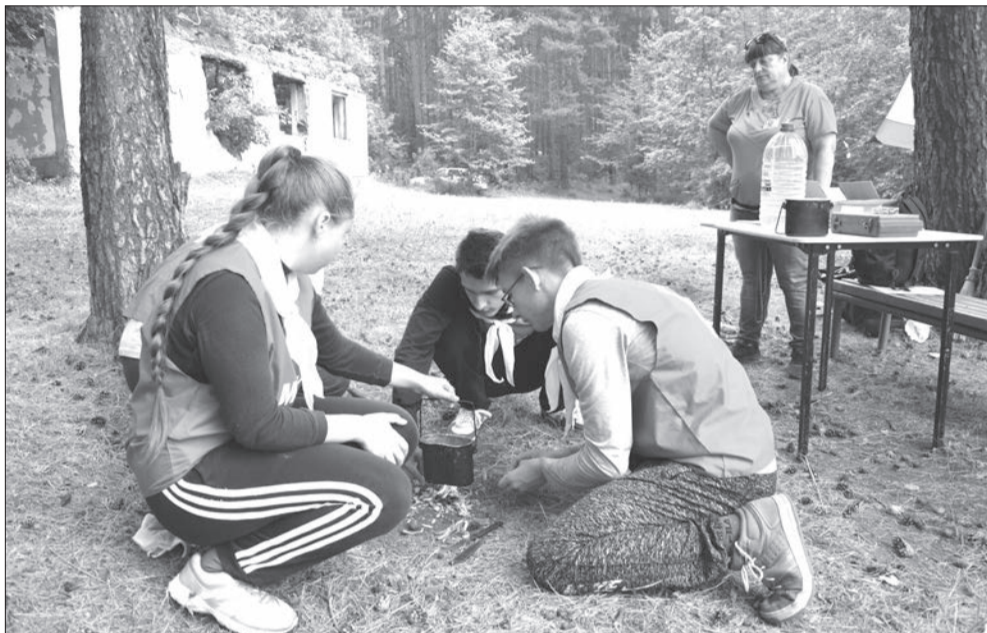
Закипает вода в котелке

Спортсмены могли проходить тропу в любой последовательности. На чем настаивали судьи, так это на правильной экипировке и контрольном грузе (компасе, запасе питьевой воды и медицинской аптечке), что надлежало носить с собой и который, кстати, мог быть проверен на любом этапе.