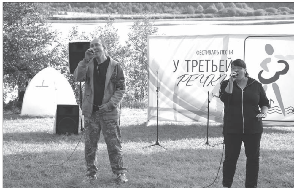
До новых встреч, друзья!