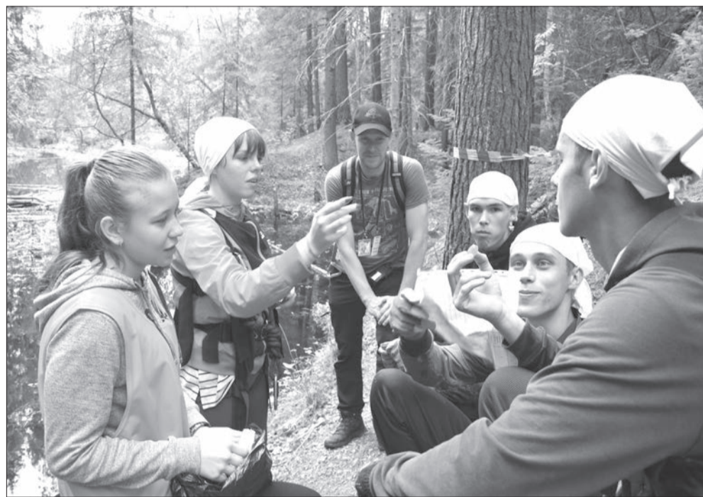
Угостись конфеткой - получишь балл