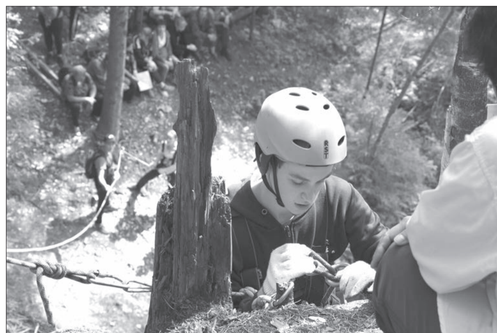
Скалу покоряли смелые