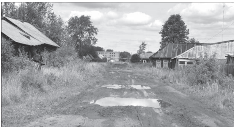
В России две беды

Здание, которое она умудрилась сохранить и где сделала все своими руками, покупатели берут только под разбор... Слово