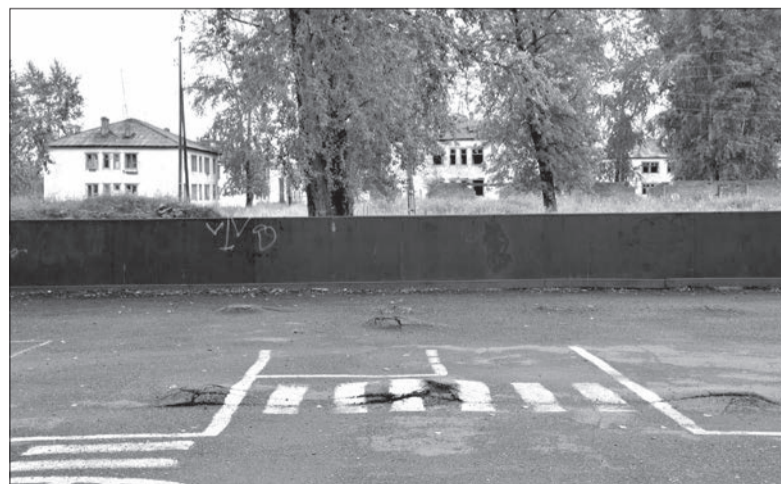
Корт ждет ремонта