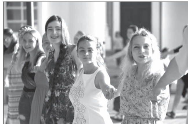
15 августа, в Верхней Салде на Дворцовой площади прошла крупномасштабная хороводная акция «Хоровод мира».

24 августа Верхняя Салда отметит 241-й День рождения