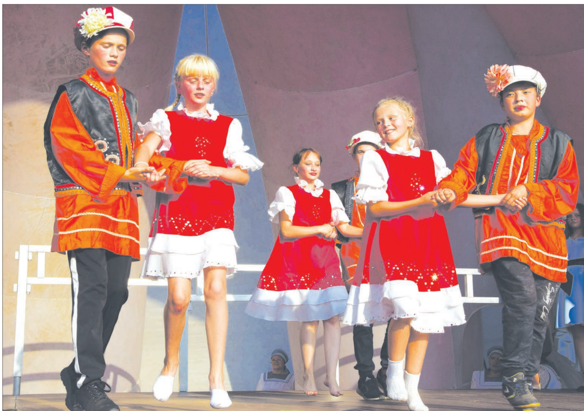
Кадриль моя, сердечная...