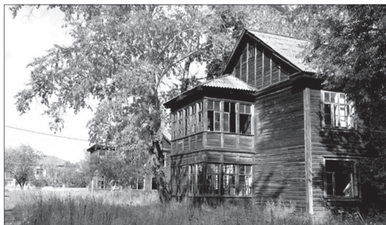
Деревянное прошлое Басьяновского

писаны люди, уехавшие в город на заработки, где вынуждены снимать жилье.