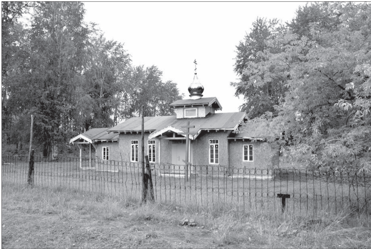
Дорога к храму

От былого деревянного величия остались два красивой архитектуры ветхих барака, в которых, кстати, по-прежнему про-