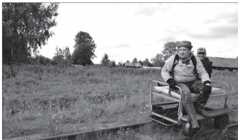
С ветерком на «пионерке»

Нет дороги к живым, и нет ее к умершим. Не попасть сегодня на местное кладбище, чтобы навестить предков. Куда там идти семь километров через болото! Четыре года назад на погост ездили на тепловозике, к которому цепляли 8-9 вагонов. Народу