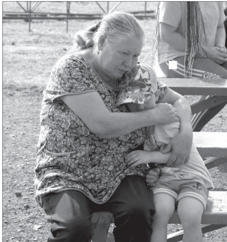
В ожидании праздника

- Посмотрите на березки спиленные, - показали мне ветераны, когда мы дошли до окраины поселка. - Жалуемся на это варварство, а нам отвечают, что, мол, лес у нас больной. Но не верим мы, опасаемся, что будет у нас, как на территории Алапаевского