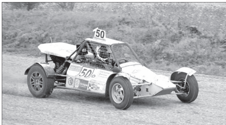
На трассе - Дмитрий Евстратов