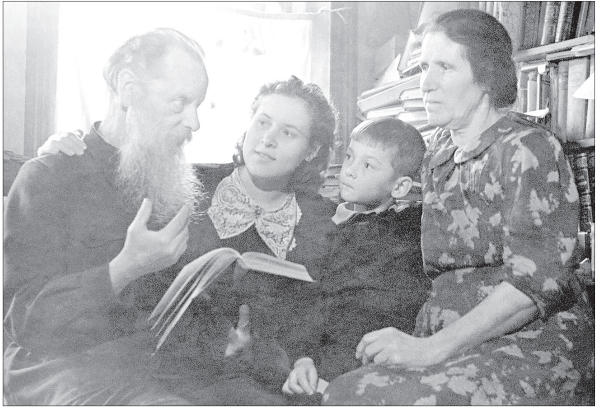
Павел Бажов с супругой, дочерью и внуком. 1944 год

Эти стихи, написанные Павлом Петровичем, посвящены любимой женщине, невесте и другу. Гражданская война, накатывавшая на Россию, разлучила их. Красные войска Урала отступали под на-