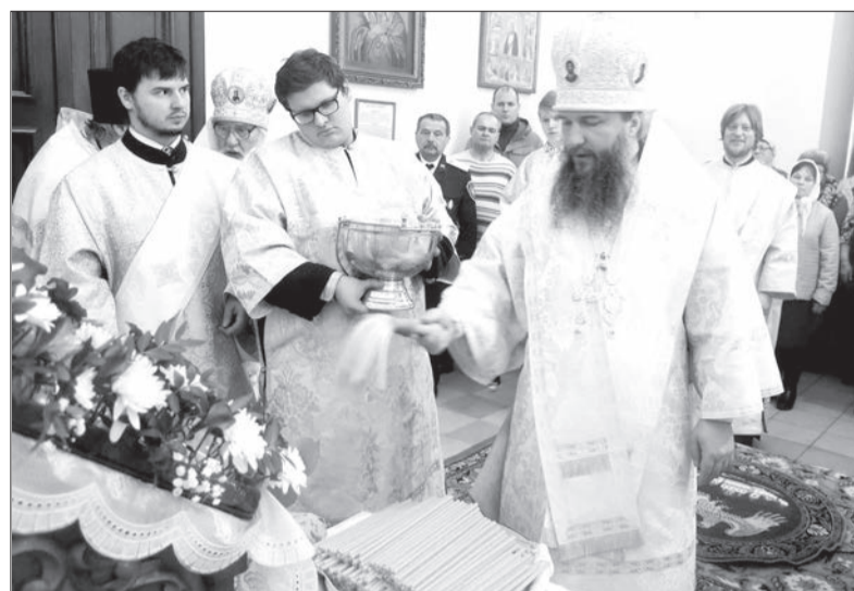
Чин освящения свечей

По материалам официального сайта Нижнетагильской Епархии.