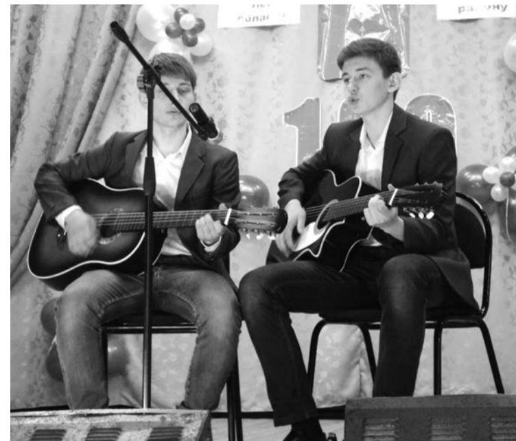
Один из творческих номеров