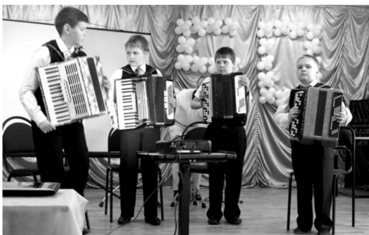
Ученики музыкального отделения