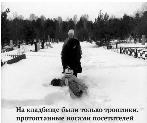
На кладбище были только тропинки. протоптанные ногами посетителей

Всех нас погодное явление в виде обильного снегопада в конце апреля, мягко говоря, удивило. Во всяком случае я за свои последние годы ничего подобного не видела.