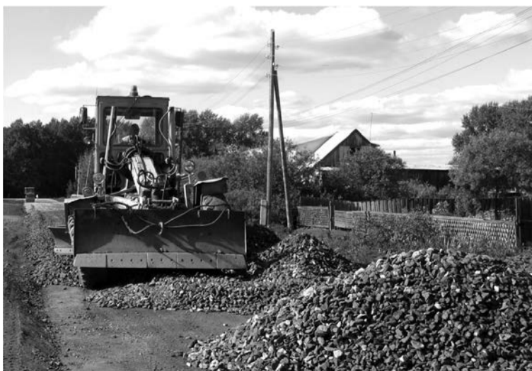
Строительство новой дороги