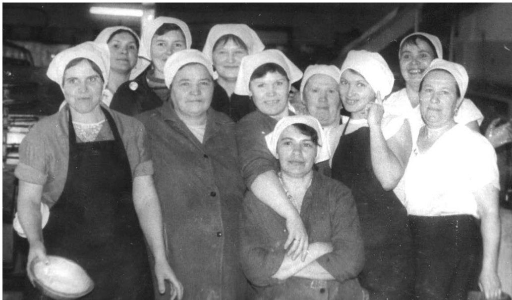
Рабочие кондитерского цеха. 1980 год.

Хлебокомбинат постоянно модернизируется с целью соответствия времени и удовлетворения потребностей населения.