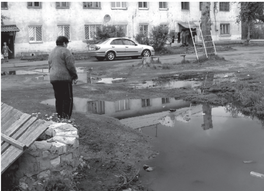
Дышать нечем. Детям играть негде.