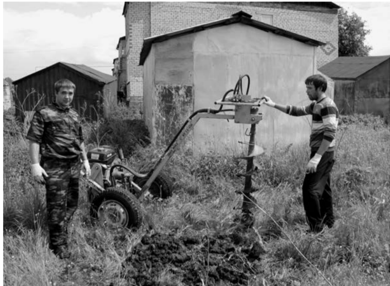
Установка столбов ограждения

Это первое детское дошкольное учреждение, которое строится после более чем 20-летнего перерыва