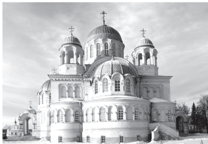
Крестовоздвиженский собор в Верхотурье

Святой праведный Симеон Верхотурский (1607-1642 гг.), небесный покровитель земли уральской... При одном упоминании этого имени становится тепло и радостно на душе. Кроткий и смиренный, тихий, скромный, любящий Бога и людей... Тысячи и тысячи паломников приезжают в Верхотурье на его праздники, которых у него четыре в году: 25 сентября (первое перенесение мощей), 25 мая (второе обретение мощей), 31 декабря (день прославления), 23 июня (Собор Сибирских святых).