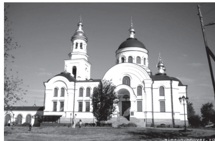
Храм в Меркушино на месте обретения мощей святого Симеона