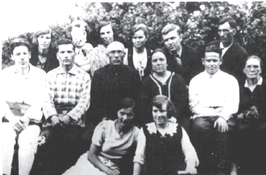
Педагогический коллектив школы

Музей не пустует с момента создания. Здесь проходят митинги, вечера на военную тематику, дни памяти.