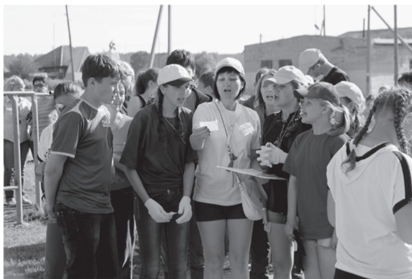
Командная работа по проектам

После торжественного открытия фестиваля на кокуйской