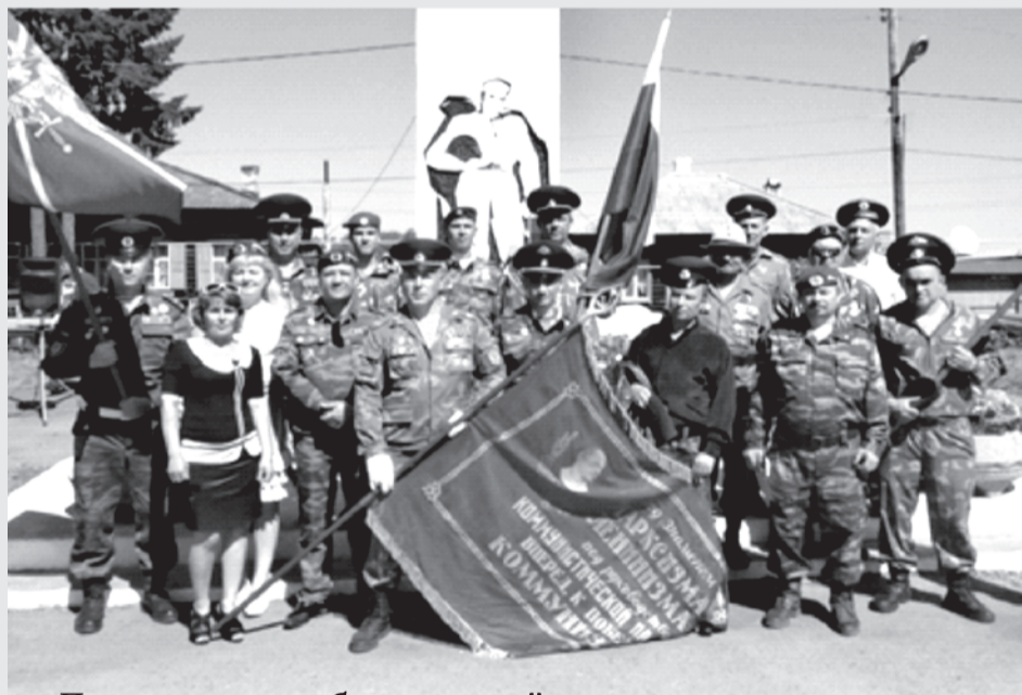
Представители общественной организации «Ветераны пограничники Талицкого городского округа»