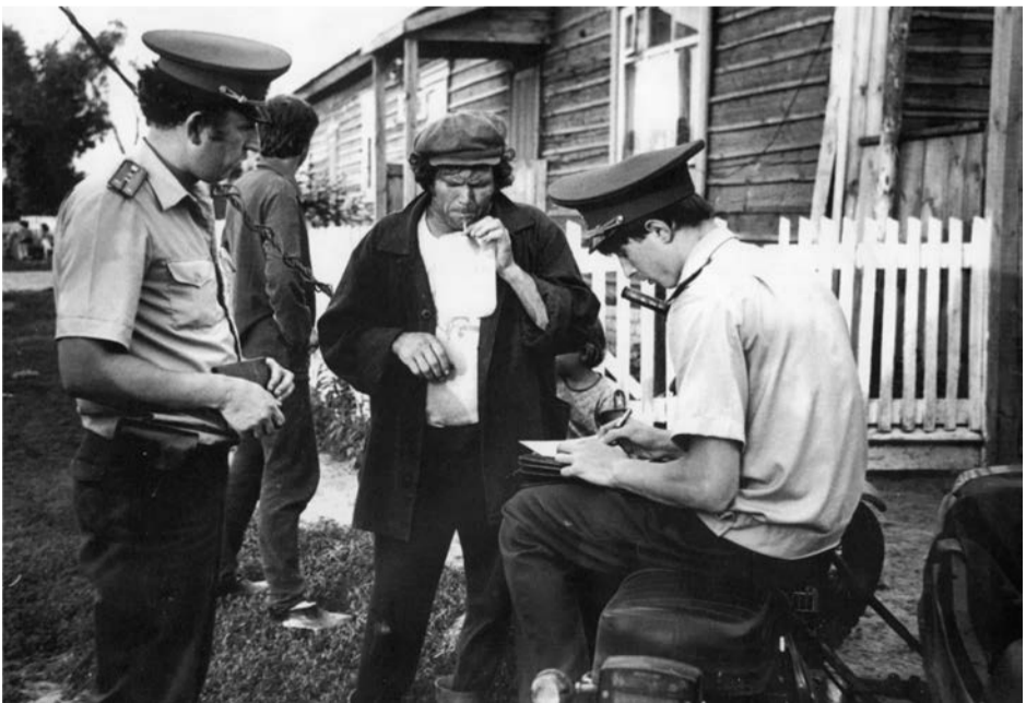
... вот алкотестер и покажет ваше промилле