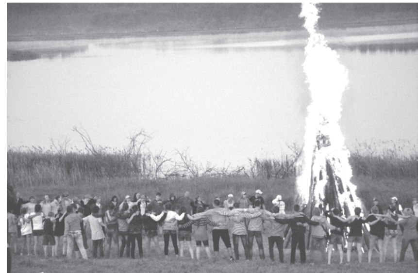
Большой «пионерский костер»

на которой будет проходить районный фестиваль в 2015 году! Флаг передали представителям Яровской управы.