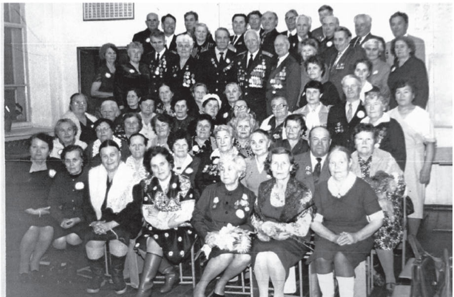
Встреча выпускников предвоенных лет