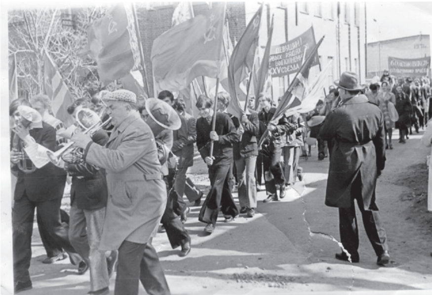
Талицкий лесотехнический техникум на демонстрации с духовым оркестром

тры были в пос. Троицком (ДОКе, фабрике валяной обуви, школе № 5); в с. Бутка (Доме пионеров и Доме культуры); в пос. Пионерском (средней школе и Доме культуры). В других населенных пунктах района духовые оркестры пытались создавать энтузиасты, но они прошли только уровень организационный и существовали до одного года, т.к. руководителей оркестра не было.