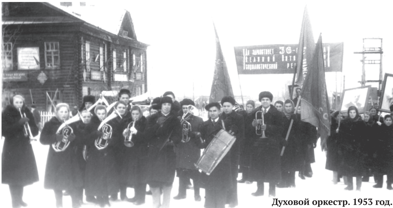
Духовой оркестр. 1953 год.