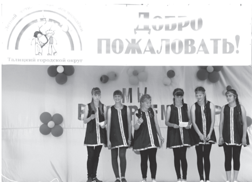
Презентация одной из команд фестиваля

И, конечно, прошла передача флага фестиваля той территории,