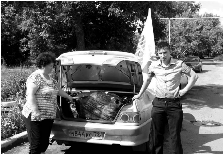
Гуманитарная помощь от таличан уже в пути на Украину

Большинство наших граждан, далеких от политических интриг, до сих пор в недоумении, как может руководство страны допустить уничтожение собственного народа, как можно отдавать приказы бомбить мирное население? Все мы видим по телеэфирам, как люди бегут через границу чуть ли не в пижамах, как умирают прямо на улицах... Гуманитарный коридор для эвакуации мирного населения из зоны боевых действий - это, пожалуй, еди-