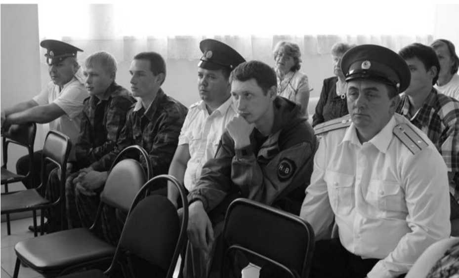
Зрители мероприятия - казаки станицы имени Н.И. Кузнецова