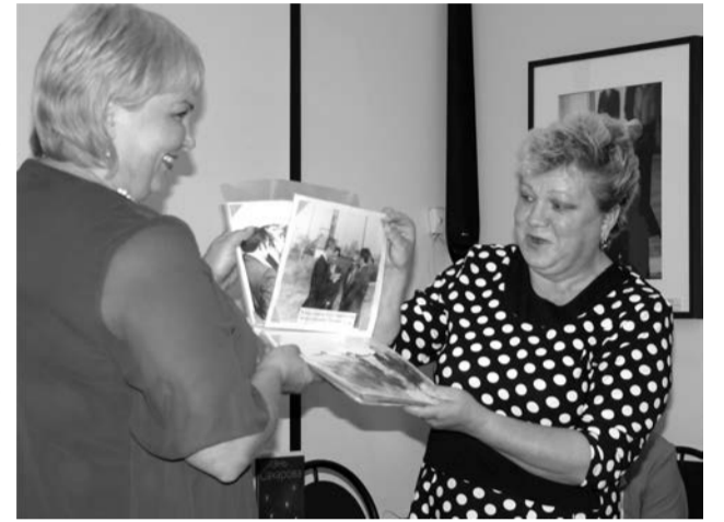
Тот самый альбом, который вызвал интерес у многих

Маленький альбом вызвал большой неподдельный интерес – кто-то тут же делал снимки с оригиналов, кто с пристрастием