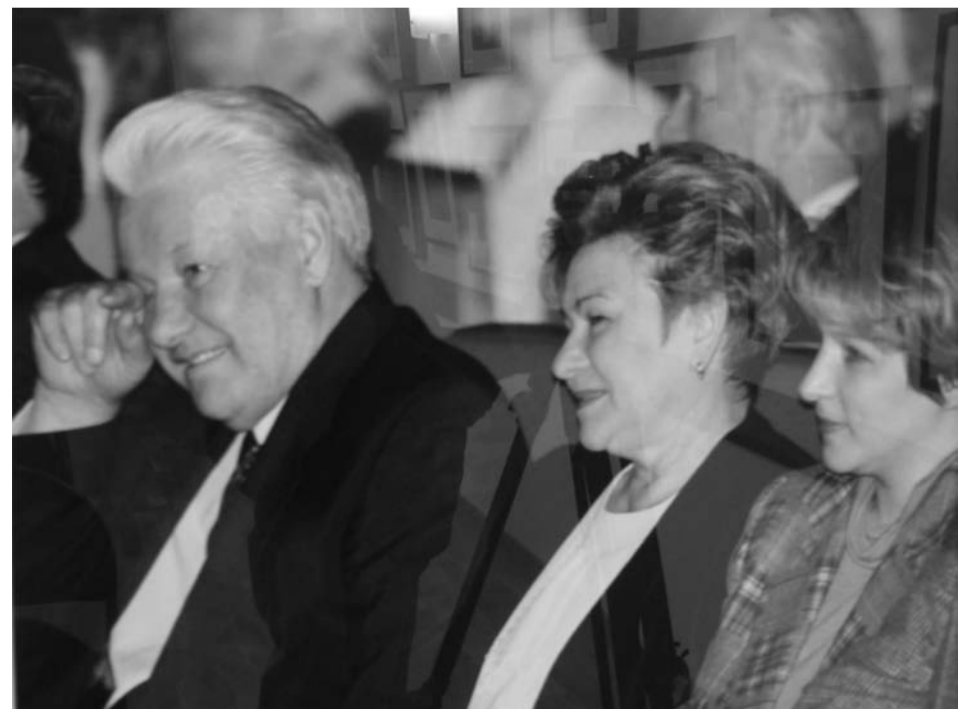
Один из снимков с фотовыставки. Борис Николаевич с женой и дочерью Татьяной