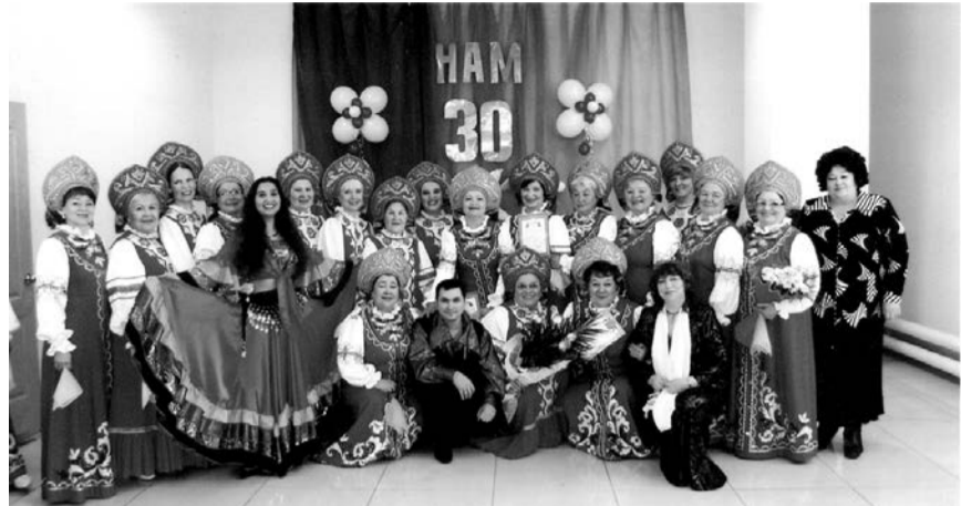
30-летний юбилей ансамбля.

Наш ансамбль для многих стал действительно второй семьей