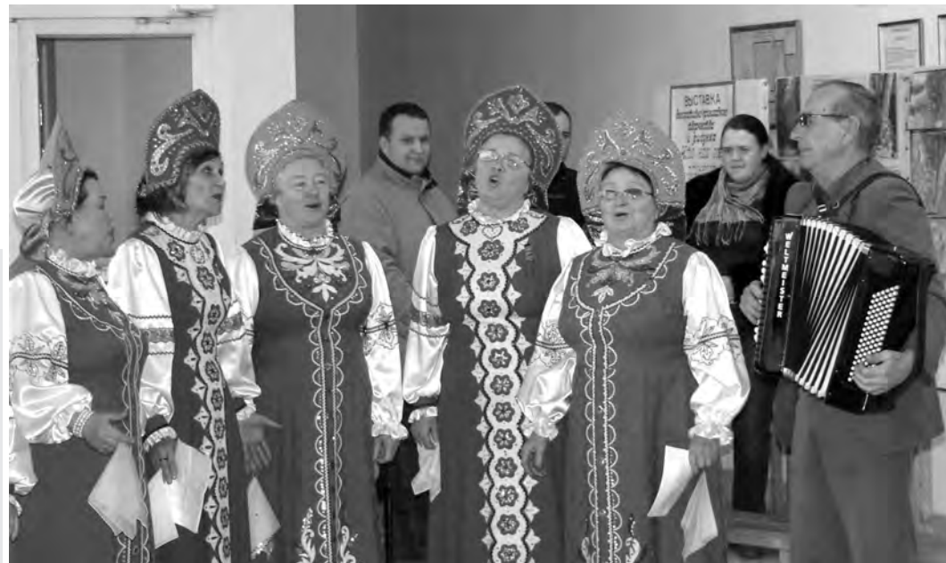
«Кто умеет веселиться, того и горе боится» (Ансамбль песни и танца М. Панкратова)