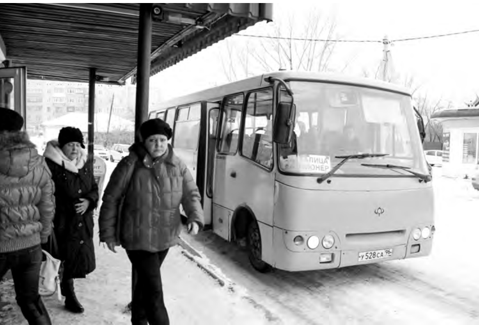
Центральная остановка в Талице – всегда оживлённое место

Беседовала О.Паникаровская.