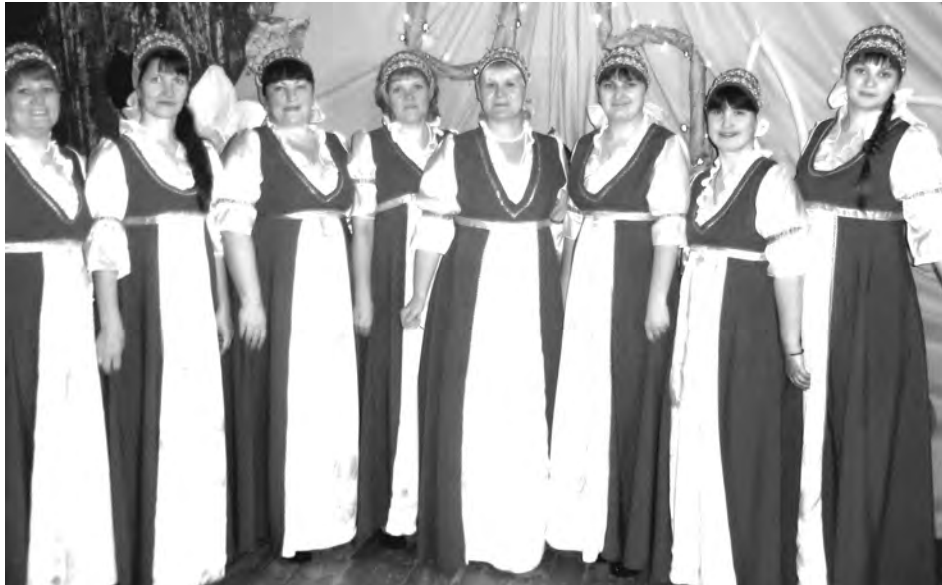
Вокальная группа «Виктория»

На сцене Дома культуры посвящали в рабочие, принимали в пионеры и в комсомол, вручали первые паспорта, здесь торжественно регистрировали молодые семьи. Сцена ДК стала памятной для многих басмановцев, очаг культуры жил вместе с нами и принимал самое активное участие в жизни страны, своего села и семьи.