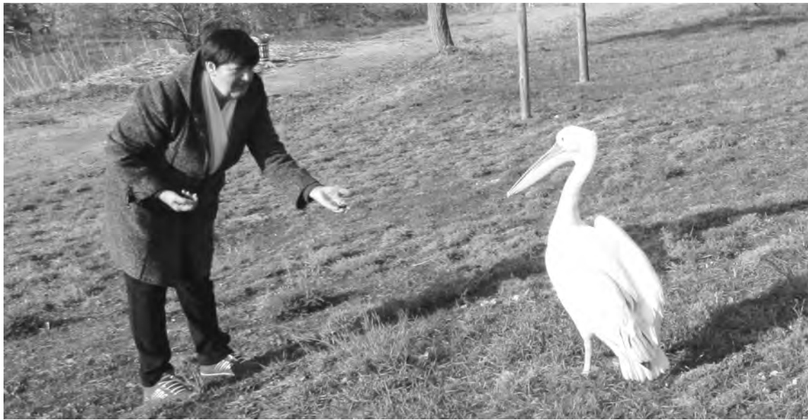
Угощение для пеликана Кузи

Наталья Стихина.