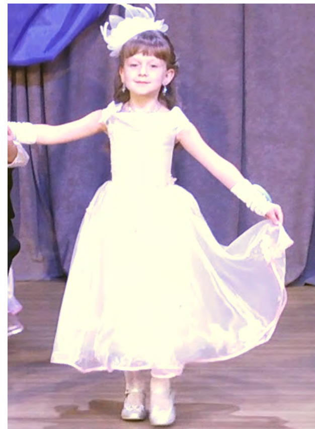
Вот она - «Мисс «Малышка-2014!»