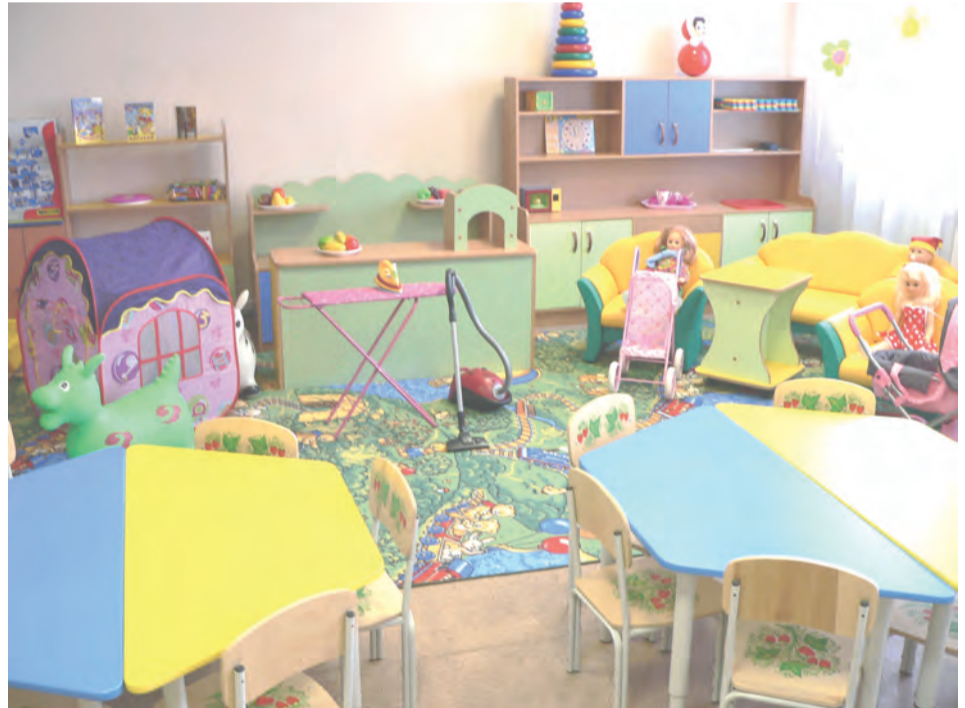
В такой сказочной комнате будет интересно малышам