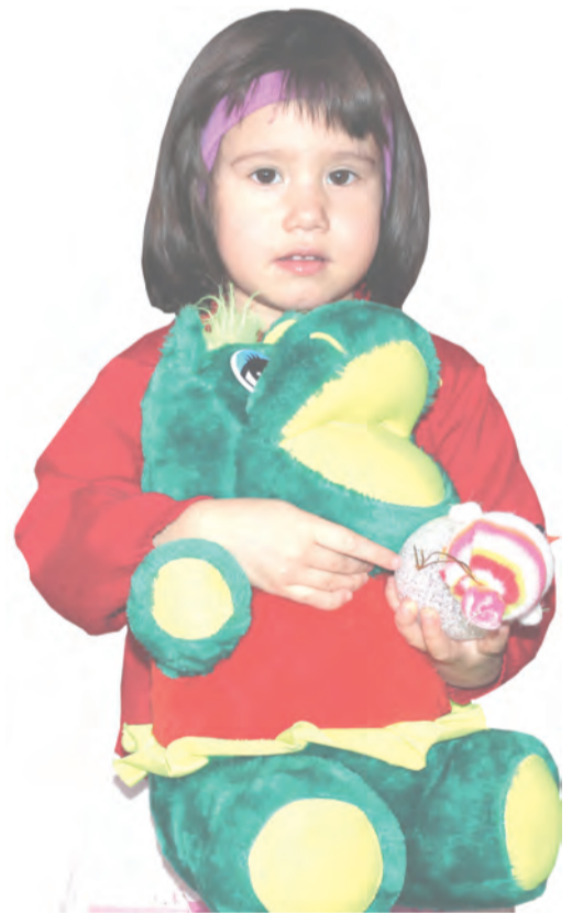
Игрушки пришли по душе