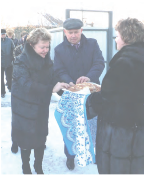
Хлеб-соль дорогим гостям и помощникам

Оценив детский сад снаружи и внутри, все, кто приехал на открытие «Елочки», ставили за работы щедрые «пятерки».