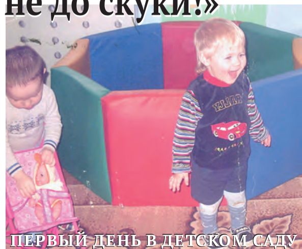
ПЕРВЫЙ ДЕНЬ В ДЕТСКОМ САДУ

Продолжаем наш фотоконкурс, уважаемые читатели!