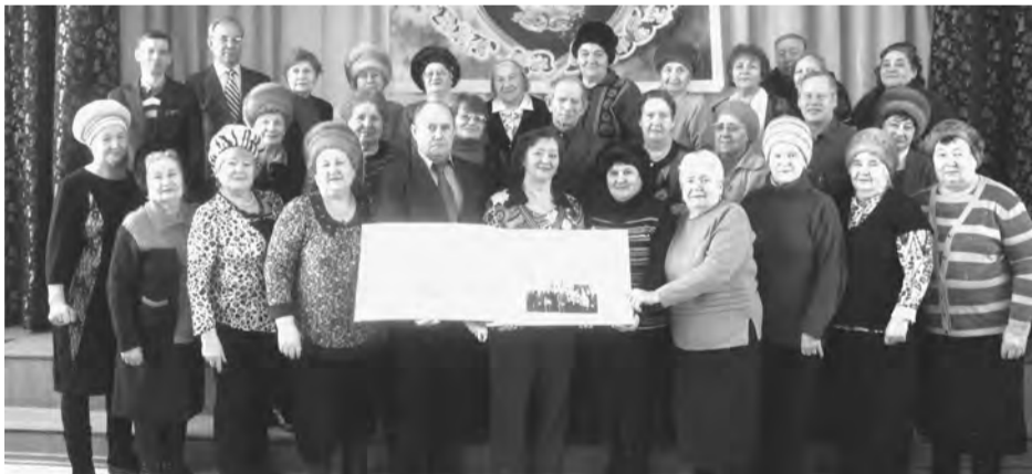
Объединив даже необъединяющихся, городской совет ветеранов экзамен выдержал! Поздравляем!