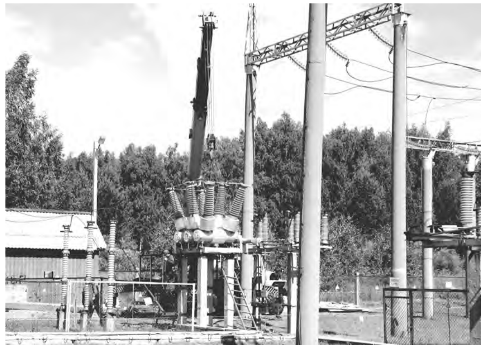
Монтаж элегазового выключателя на ПС Чупино