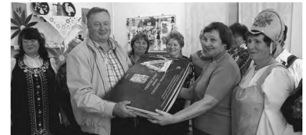
Путь от коммуны к совхозу «Смолинский» был тернист и овеян славой героев гражданской и Великой Отечественной войн. Спасибо вам, смоляне, за память.