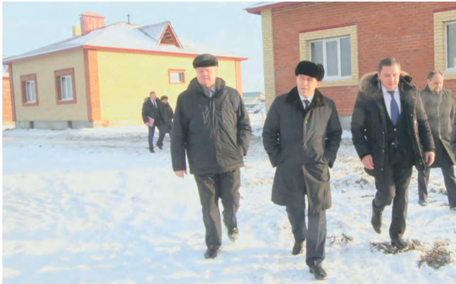
На территории «Жемчужины» (п. Троицкий) пока 9 домов, а бюджет - больше 50!