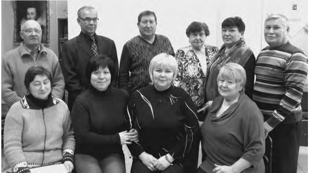
Орг.комитет районного совета ветеранов

Приглашаем весь актив участников акции «Наследие» на заключительное мероприятие под названием «О людях добрых и делах хороших» в РИКДЦ «Юбилейный» 19 декабря, в 13-00.