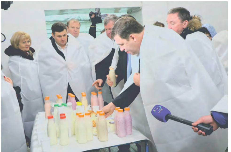
Талицкое, действительно, лучшее - убедился губернатор

«Я прекрасно знаю, какие вопросы волнуют жителей таких территорий, как Талицкий городской округ, да и повсеместно - это образование, здравоохранение, ЖКХ. Я еще раз убедился в этом, когда проводил сегодня встречу с жителями. Но я вижу, что вы успешно продвигаетесь в решении существующих проблем. Конечно, всем хотелось, чтобы задачи