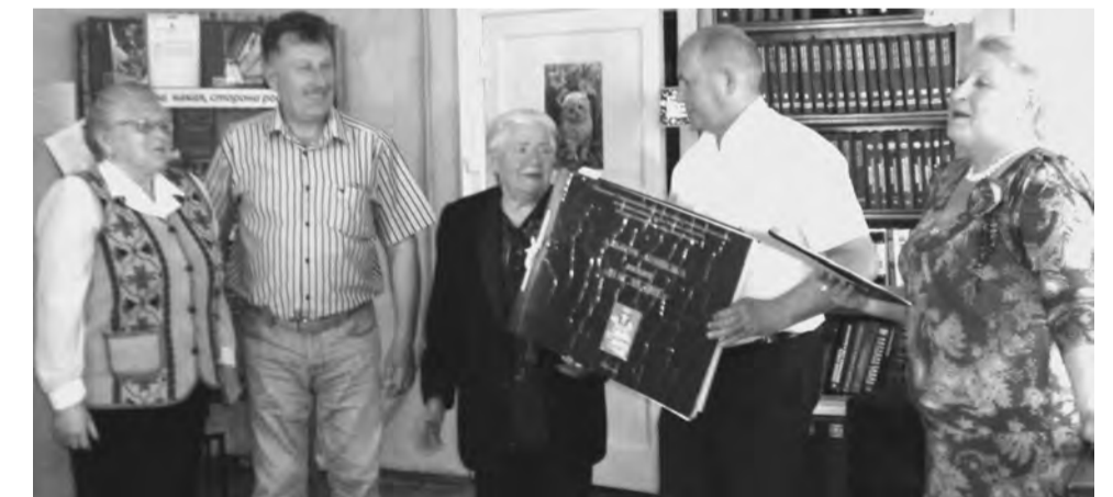
В пос. Троицком сосредоточился самый ответственный актив. Сделали столько, сколько не могли сделать пять сельских управ. Вы лучшие!