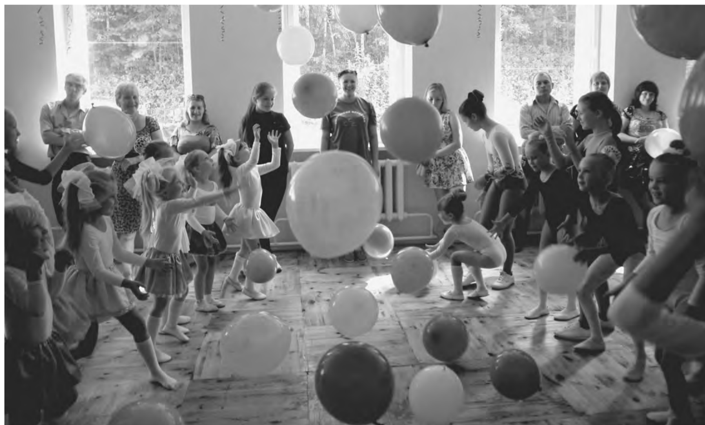
Спортшкола, с новосельем!