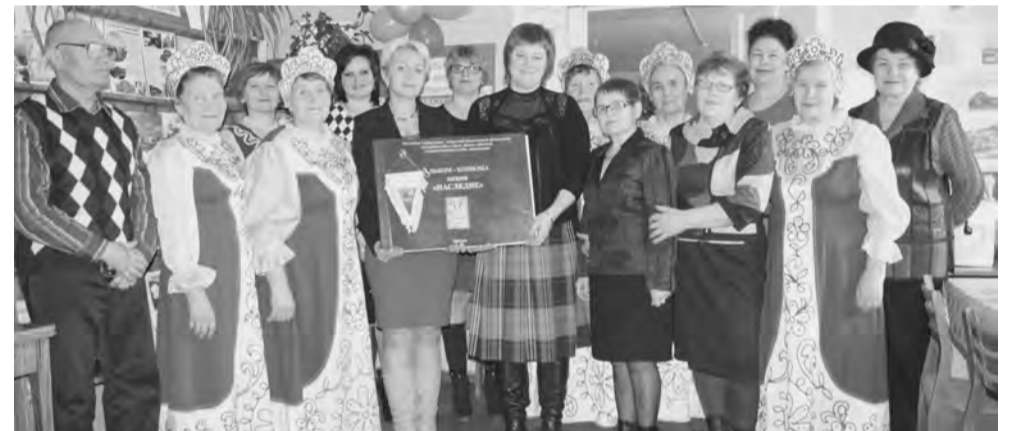
Совет ветеранов с задачей справился... Собрано материалов за всю Юрмытскую волость. Самый богатый материал об истории коммуны, колхозов, мощного совхоза «Рассвет». Спасибо ! С Новым годом!