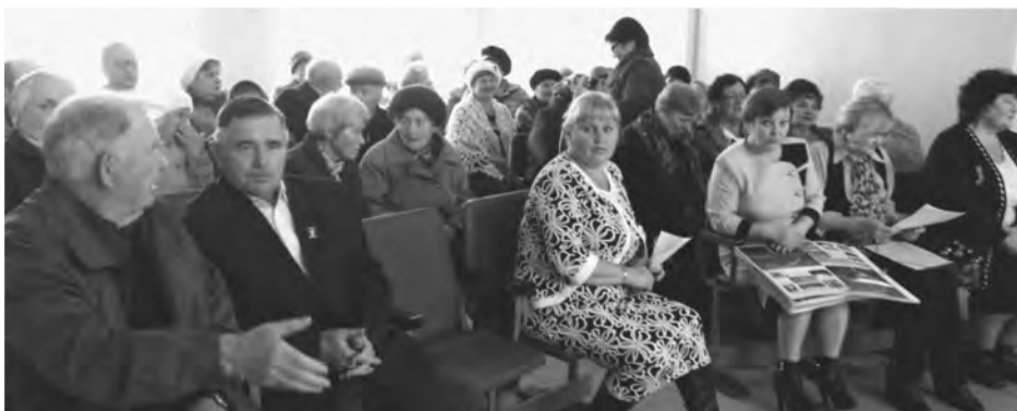
Фабрика орденоносцев племзавода «Пионер» нашла отражение в трудах Совета ветеранов этой управы. Вклад пионерцев, как и в прошлые годы, бесценен. Низкий вам поклон.