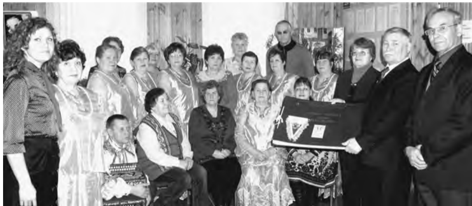
Совет ветеранов Буткинской управы начинал Марафон... Было ответственно, интересно. Материалы собраны и оформлены в пример всем. Молодцы!