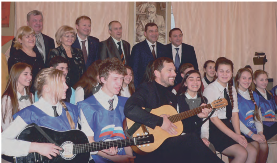
С такой молодежью можно смело смотреть вперед!

На этом мажорный «пионерский аккорд» не закончился, на втором этаже школы ждали встречи с губернатором школьные активисты, члены Пионерского отделения «Молодая гвардия Единой России». Встретили по-юношески задорно, под гитару, даже – собственной песней, которая практически стала девизом активистов: