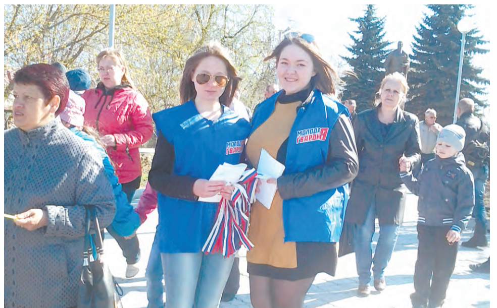
Акция «Георгиевская ленточка»

местного отделения ВОО «МГЕР» летом 2014 года участвовали в самых масштабных форумах России. Больше всего