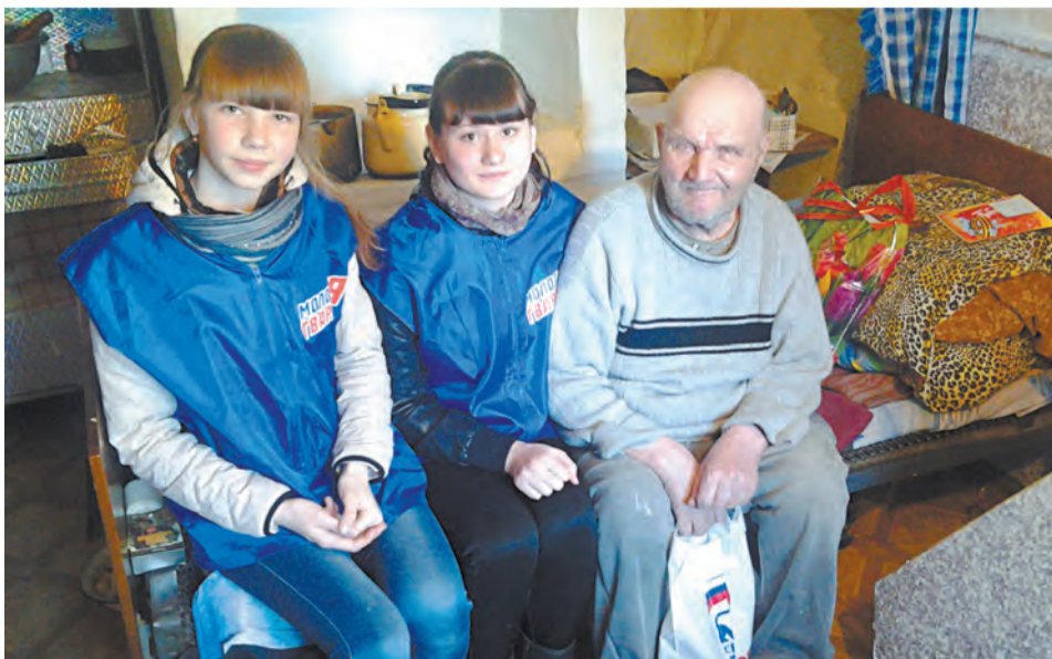
В гостях у ветерана