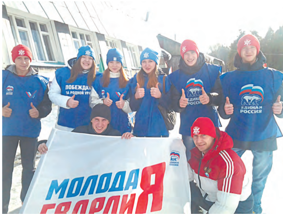
Наша дружная команда

Под волонтерским направлением мы подразумеваем тесное взаимодействие с Молодёжным Парламентом Свердловской области, МБУ «Спорт-Сервис», ВПП «Единая Россия», Совет ветеранов Афганистана, Совет ветеранов пограничных войск, Фонд поддержки любительского спорта и молодёжных инициатив Свердловской области и помощь им в проведении мероприятий. Ребята из «Молодой гвардии» - активные участники всех молодёжных акций, а также акций, проводимых по инициативе партии «Единая Россия». «Молодая Гвардия»