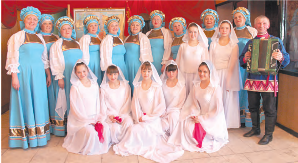
Ансамбль песни и танца «Россияночка»

4 апреля 2015 года проведен I отборочный тур VII областного фестиваля художественной самодеятельности предприятий и организаций АПК Свердловской области «ВЕСНА НАДЕЖД» под девизом «Это гордое слово – Победа».