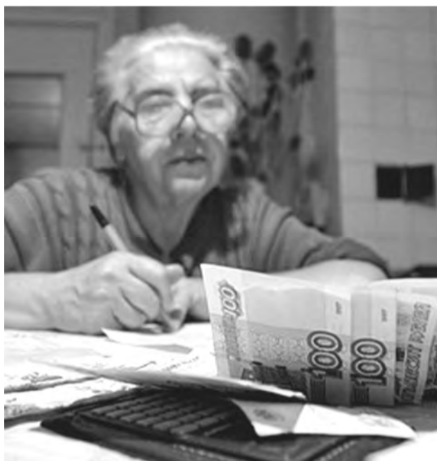
Компенсация обозначает возмещение потерь, понесенных убытков, расходов.

5) документа о неполучении мер социальной поддержки по оплате жилого помещения и коммунальных услуг по месту жительства (в случае обращения за назначением компенсации расходов по месту пребывания).