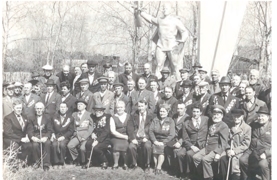
Ветераны Великой Отечественной войны у обелиска. 1982 год.