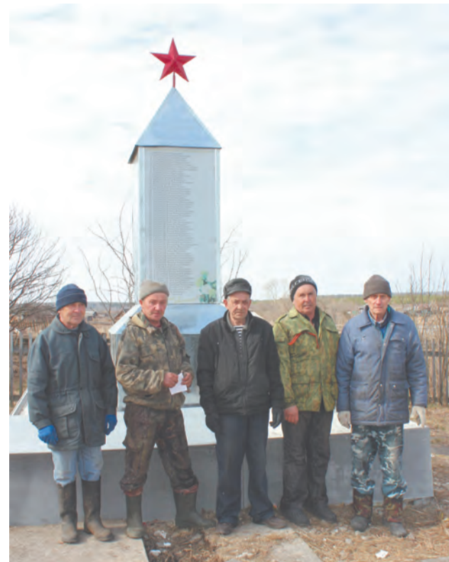
Отремонтировать памятник - это наш долг

С одной стороны, ремонт памятников должны заниматься органы местного самоуправления. С другой – денег на это нет, поэтому повсеместно проводятся акции с привлечением благотворительных средств. В 2014 году Талицкий городской округ один из первых обратился в Правительство Свердловской области с просьбой выделить дополнительное финансирование на эти цели. Ведь впереди – в 2015-м – знаменательная дата – 70-летие Победы! Но Минфин разъяснил, что средства на благоустройство и ремонт памятников из областного и федерального бюджетов предусмотрены только для объектов культурного наследия. У нас на территории их только два – в Зырянке и в Талице. Оба –