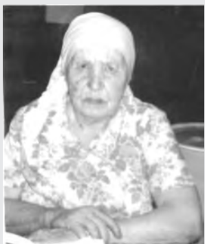
внучку, внука и правнука.

В 1941 году стала работать на ферме телятницей. Так и работала всю войну. Жили бедно, питались тем, что давали на трудодни, сажали много картошки, если ее не хватало, то весной собирали мороженую. Делали из нее шанежки, лепешки из щавеля, медунок. Так всю жизнь и проработала в колхозе дояркой, потом свиноводкой. Трудовой стаж сорок лет. Вырастили дочь, имеет