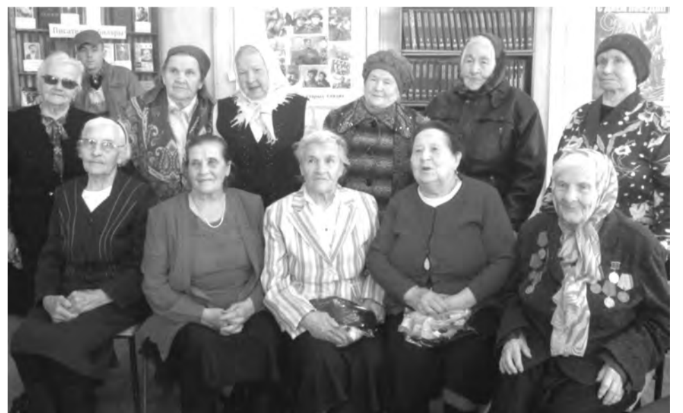
Мероприятие «Посиди со мной, поговори со мной» проводят специалисты Комплексного центра социального обслуживания населения