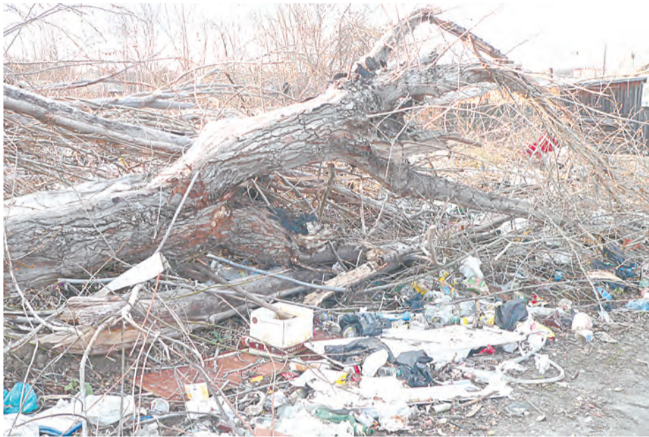
Всю и глазом не охватить свалку по ул. Советской...