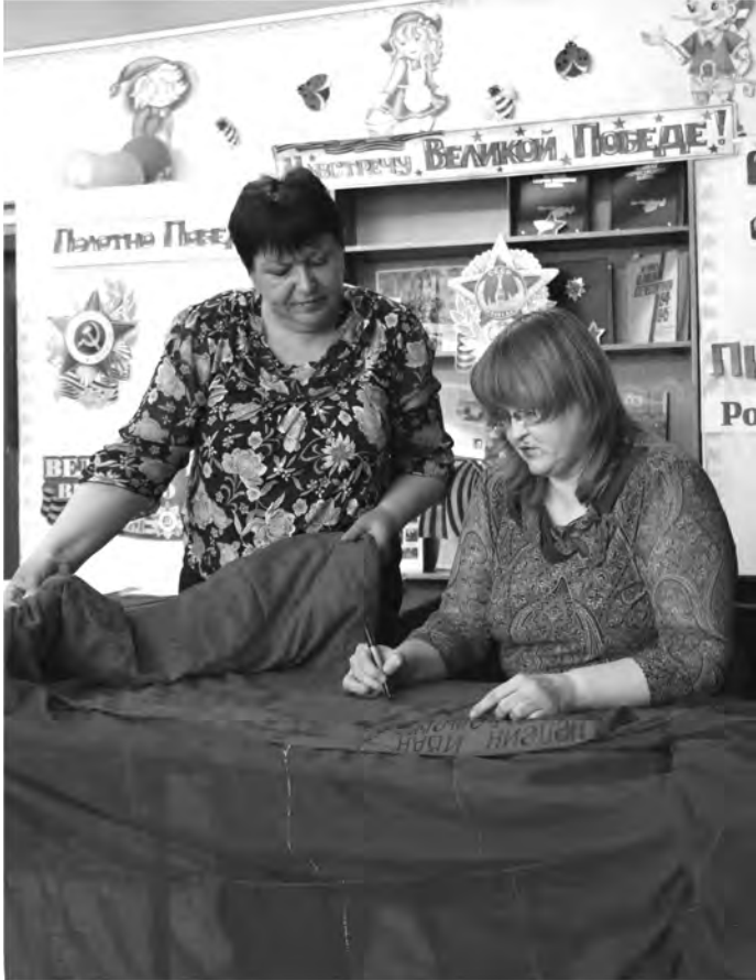
Память «сшили» по кусочкам

Каждый день в районное «Полотно Победы» добавляются все новые и новые имена участников войны. Если вписать все имена таличан, воевавших на фронте, то единое Знамя Победы можно будет растянуть от Троицкого до Талицы, а его длина будет минимум 8 километров!