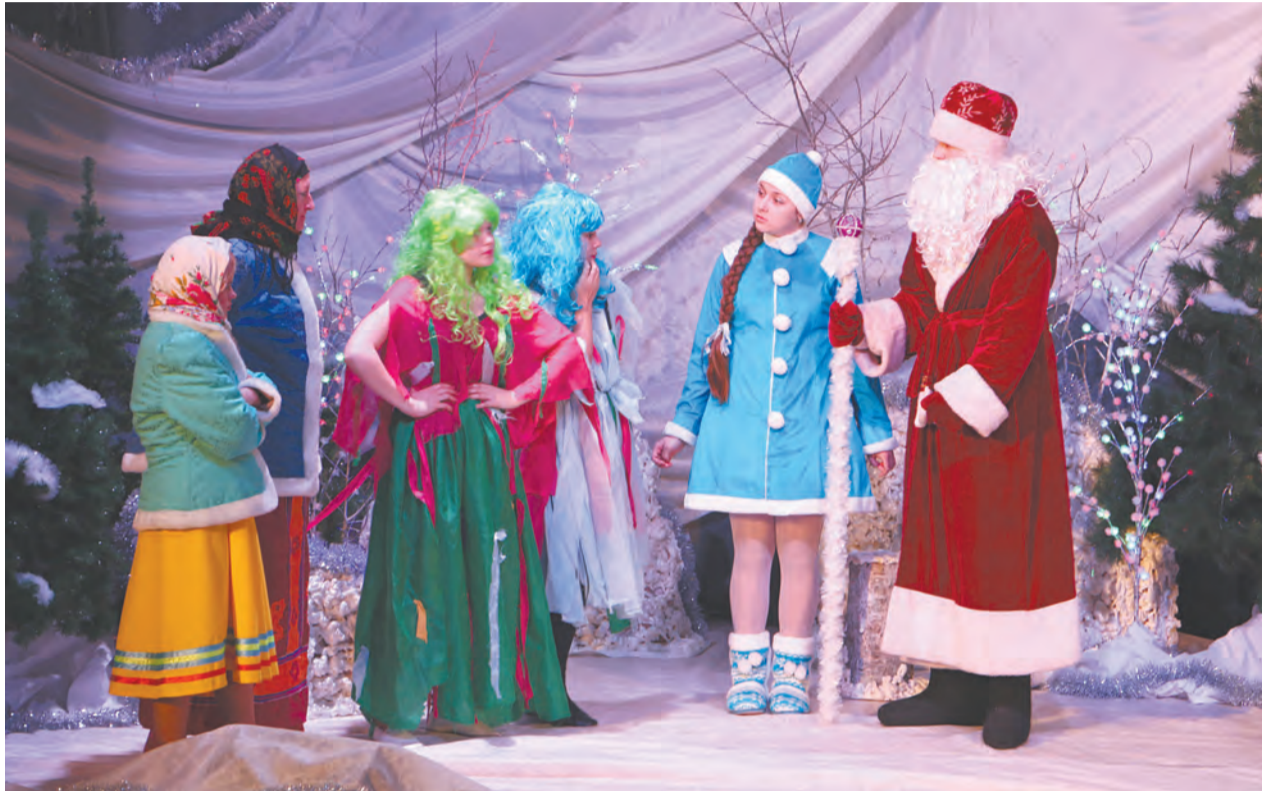
Финальная сцена «Зимней сказки»

Отличившиеся в учебе ребята, победители олимпиад и конкурсов, фестивалей и спортивных соревнований по традиции собрались в этот день на ёлке главы