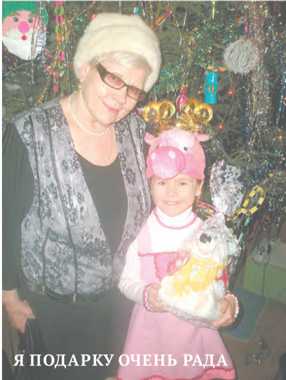
Я ПОДАРКУ ОЧЕНЬ РАДА

Ждем ваши фотографии по адресу редакции: Талица, Ленина, 88, с пометкой «Фотоконкурс». Конкурс продлится до 5 февраля 2015г.