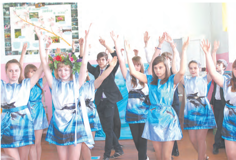
Талицкая основная общеобразовательная школа № 2

Театрализованные представления школ в этом году отличались яркостью, четкостью, содержательностью и актуальностью. Практически во всех выступлениях прозвучала суть природоохранной деятельности школы, все мероприятия и экологические акции, проводимые в образовательном учреждении.