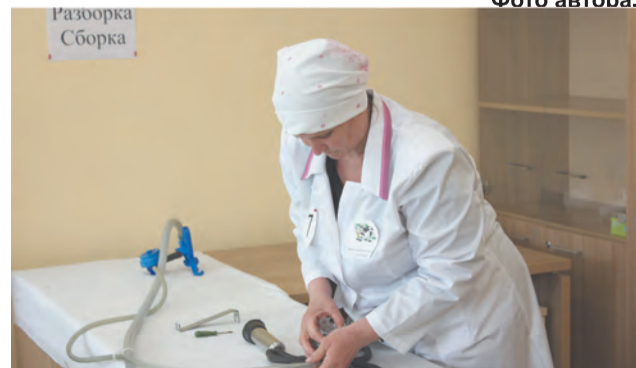
Сборка-разборка доильного аппарата