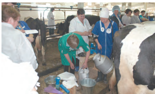
Конкурс по технологии доения