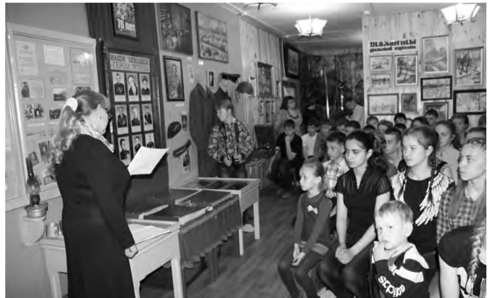
Звучат воспоминания фронтовиков