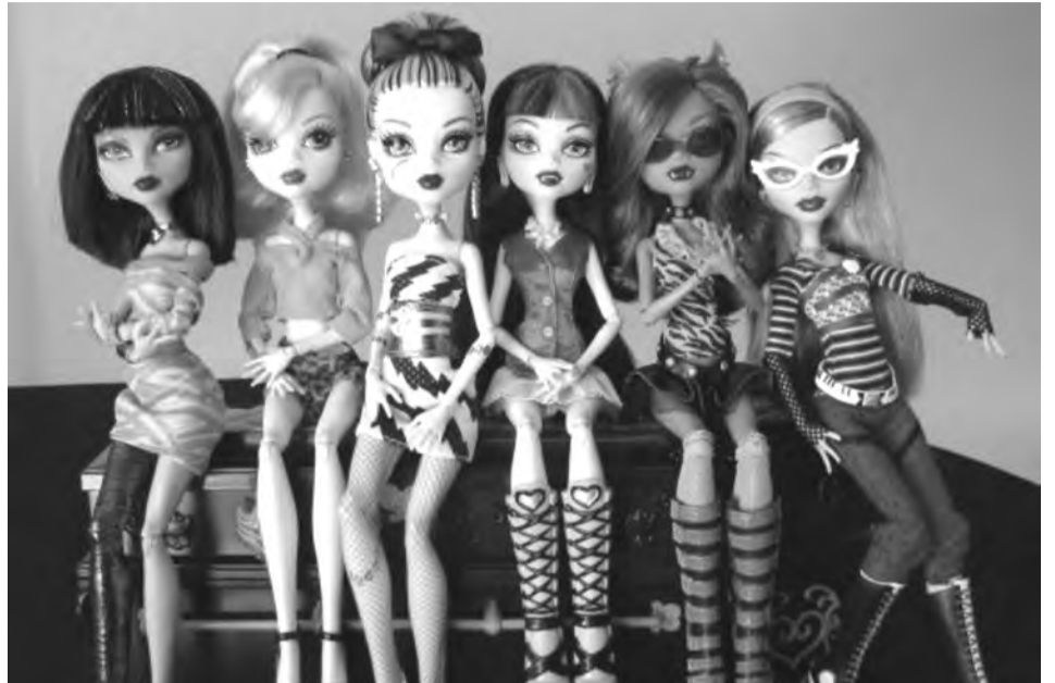
Коллекция кукол Монстр Хай - мечта девочек...

А теперь внимание. Яндекс по запросу «видео про кукол Монстр Хай» — выдает 22 тысячи видеороликов, в том числе видео игр реальных детей в куклы. Запрос на просмотр видео превышает предложение — 90 674, из них 85% приходится на РФ. За последний месяц информацию со словом «Монстр Хай» в поисковике запрашивали 1