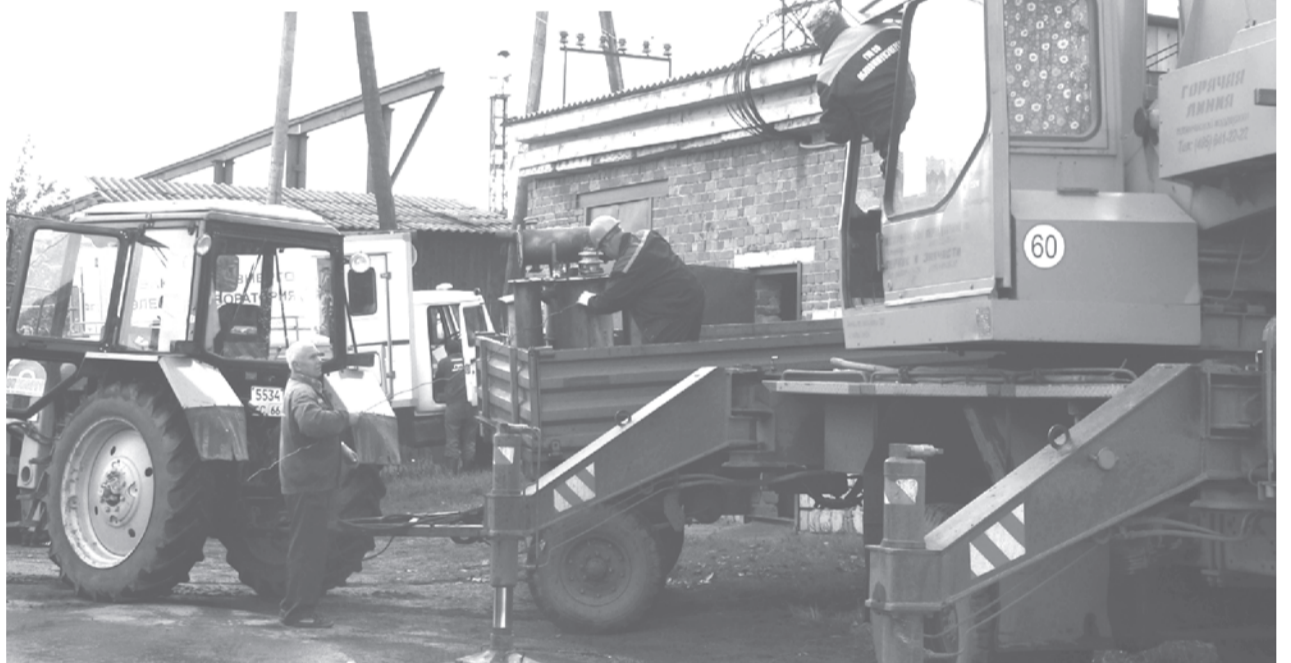
Демонтировать трансформатор непросто

Областное правительство утвердило "Схему и программу развития электроэнергетики Свердловской области на 2014-2019 годы и на перспективу до 2024 года". В целом реализация мероприятий программы позволит обеспечить энергетическую безопасность, повысить эффективность производства, надёжность энергосистемы региона и энергоснабжения уральцев.