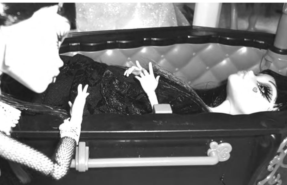
Игры с трупом в виде кукол