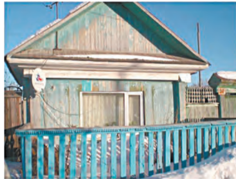
Дом семьи Глазковых

Благодаря Софье Григорьевне Ляпиной мы попытались восстановить историю нескольких семей, ушедших на фронт, не вернувшихся или вернувшихся с войны солдат.