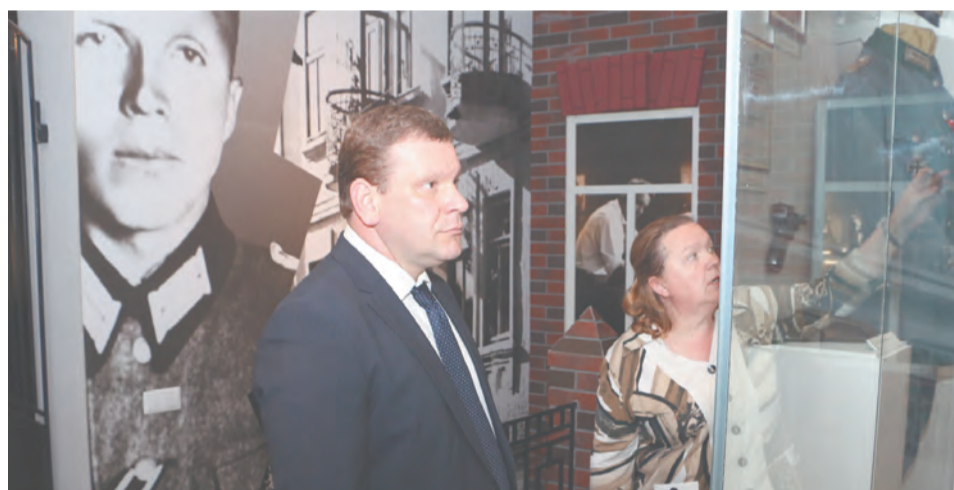
«Я с удовольствием побывал в музее...»