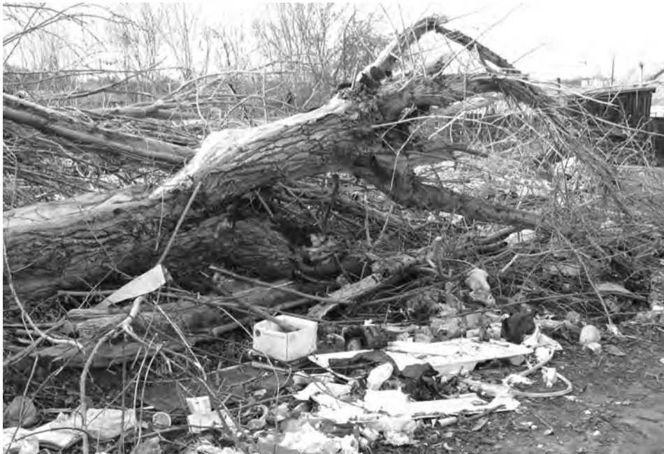
Свалка не санкционирована. Того, кто понесет и повезет сюда мусор ждет штраф от 3 до 5 тыс. руб.