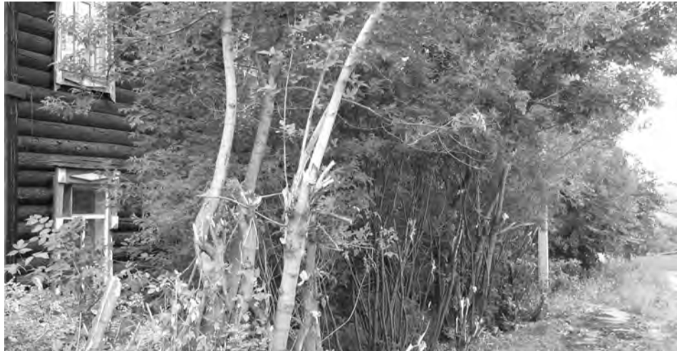
Кустарники вырубали, теперь и тротуар видно...

Работе по обращениям граждан в первом полугодии 2015 года и был посвящен один из вопросов расширенного аппаратного совещания в администрации ТГО