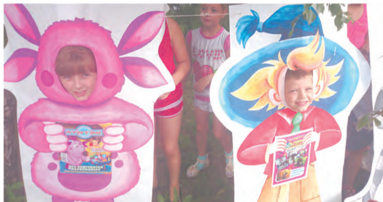
Фотоакция «Улыбки наших читателей»