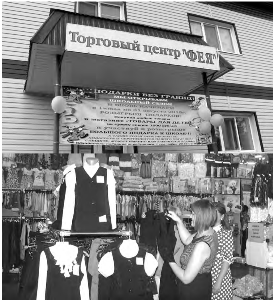
Школьные формы на любой вкус и кошелек

возраста до подросткового. Останется детская «Фея» и в п. Троицком на ул. Нахимова, люди уже привыкли.