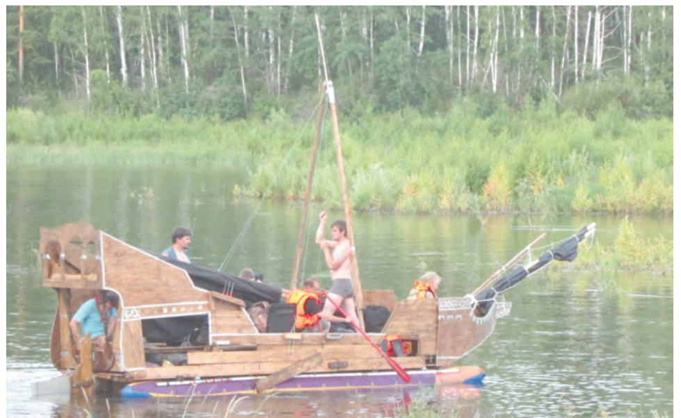
Игра с реальными кораблями

В рамках празднования 9 мая на ж/д вокзале Екатеринбурга была организована военно-историческая реконструкция «Встреча поезда Победы». На первый путь прибыл ретро-поезд, состоящий из паровоза, санитарного вагона времен войны, вагона-теплушки и открытой платформы. Во встрече принял участие губернатор Свердловской области Евгений Куйвашев. Сразу после встречи ретро-поезда, на площадке перед ДК Железнодорожников был торжественно открыт памятник «С чего начинается Родина».