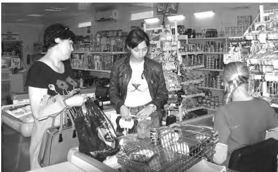
Тот самый «Апельсин» - продуктовый магазин самообслуживания