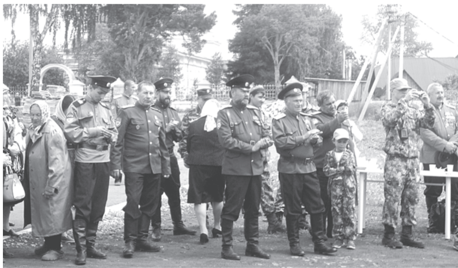
После Крестного хода люди постепенно подтягивались на звуки музыки