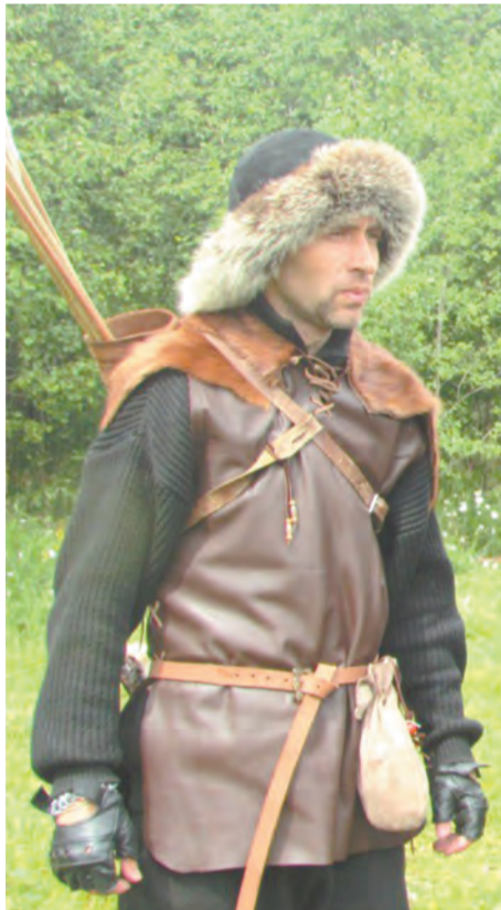
На лучном турнире