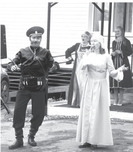
Семейная группа «Любо»