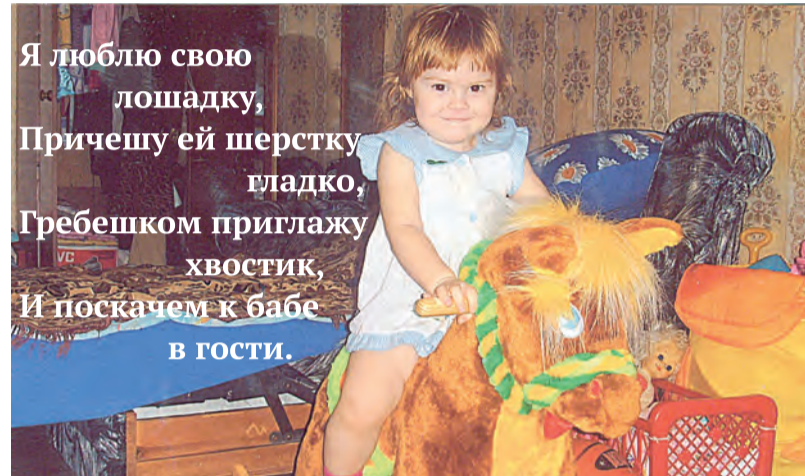
Я люблю свою лошадку, Причешу ей шерстку гладко, Гребешком приглажу хвостик, И поскачем к бабе в гости.