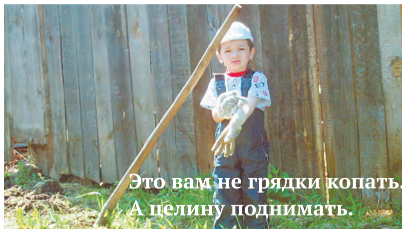
Это вам не грядки копать. А целину поднимать.