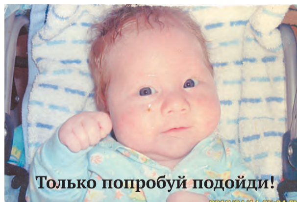
Только попробуй подойди!