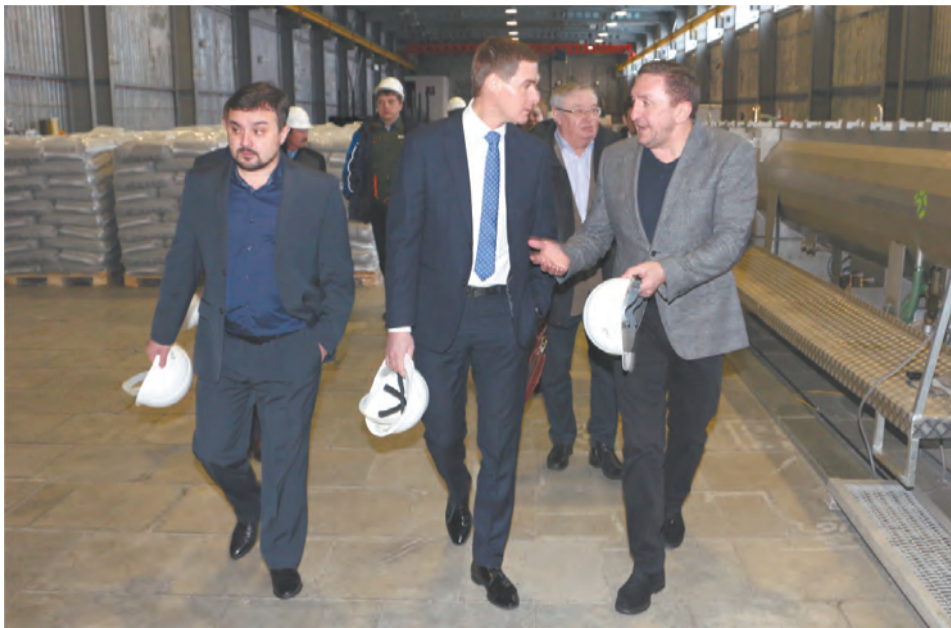
На производственной площадке ЗАО «Техстрой»

«Моя мечта — подтянуть уровень жизни в муниципалитетах, запустить активность в местный бизнес, который бывает инертным...» - министр международных и внешнеэкономических связей Свердловской области Андрей Соболев.