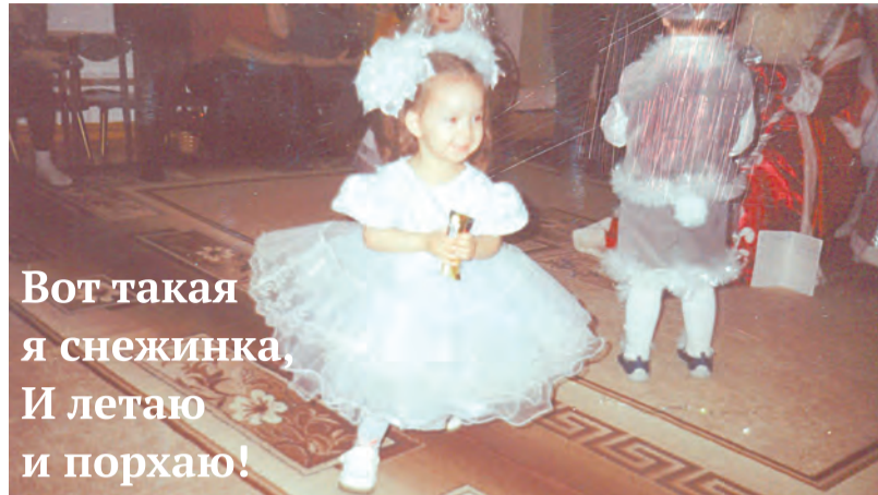
Вот такая я снежинка, И летаю и порхаю!