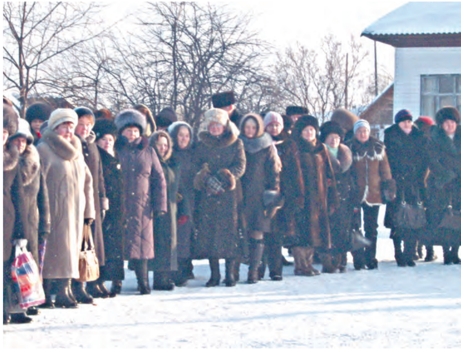
Митинг, посвященный дню рождения Б. Н. Ельцина. Буткинская управа. 2011 г.