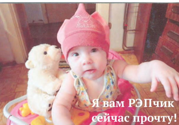
Я вам РЭПчик сейчас прочту!