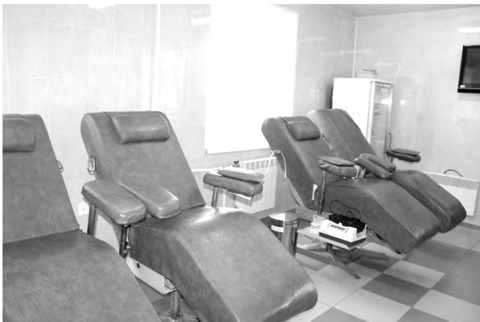
Пустой зал для доноров - итог оптимизации?