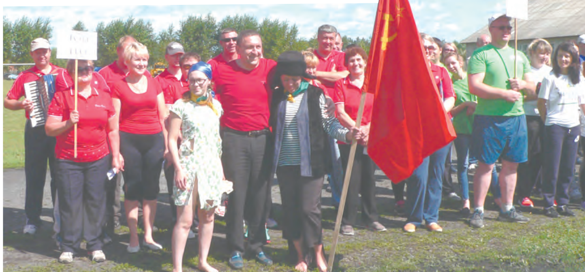
Переданы главе ТГО на перевоспитание...