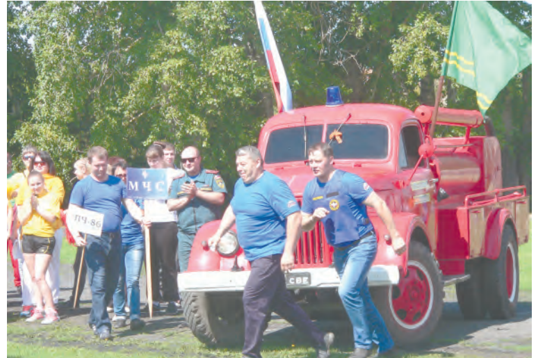
Они еще не знают, что станут победителями...

Изыюминку в «Визитке» и творческом конкурсе можно было увидеть в выступлении каждой команды. Вот команда администрации, как говорится, кружилась на небольшом пятнышке поляны, станцевав несколько танцев подряд в разных жанрах, и так этим порадовала зрителей и болельщиков, что жюри поставило им «отлично». Кстати, слово «Босс» они тоже оригинально расшифровали – «Большая организация сильных и спортивных». Команда ЦРБ под названием «Позитив» действительно была таковой, а их девиз можно поставить в знаменатель всей спартакиады: «... Даже если проиграем, позитив не потеряем!», потому что позитивом, энергией, эмоциями спартакиада