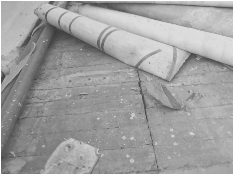
«Дальше доделывайте сами...» - в таком виде передали кабинет родителям после замены гнилого пола.

«Положение наших семей сложное в материальном плане, денег не хватает, полкласса у нас на опекунов. Между тем, ежегодно мы принимаем участие в проведении косметического ремонта...»