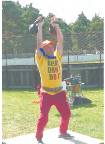
Есть 48 кг!

Согласно жеребьевке команды выходят на поляну, ставшую им импровизированной сценой, и