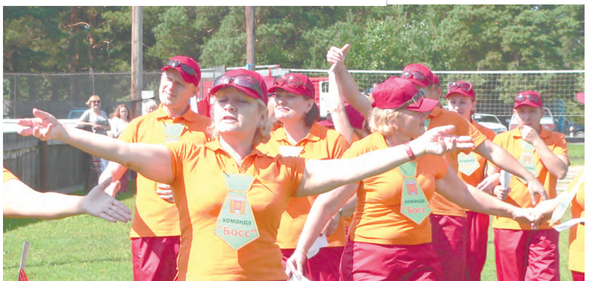
А вам так слабо? (Команда «Босс»)

И вот ближе к четырем вечера жюри подвело итоги (главный судья соревнований А. Долматов). В общекомандном зачете первое место определилось у команды МЧС (ПЧ-86). Молодцы - новички, поздравляли их даже соперни-