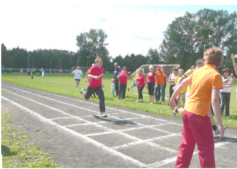
Передача эстафетной палочки