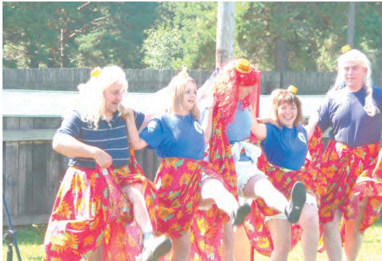
Своим танцем всех удивила команда «Убойная сила»

Позитивом, энергией, эмоциями спартакиада зарядила всех и надолго.