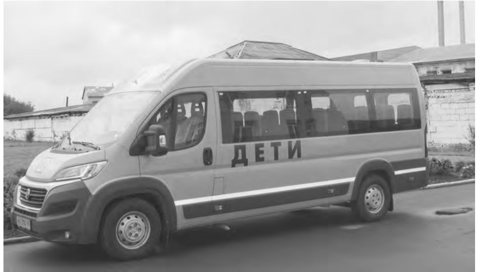
Новый автобус школы №5