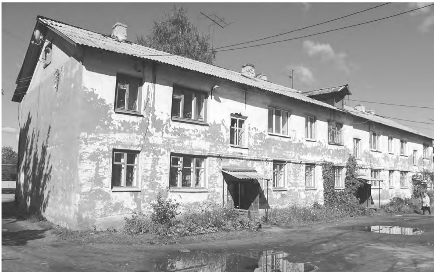
Ждёт ремонта ещё в этом, 2015 году, дом №23, по ул. Циховского

Оценку «идущего» капремонта многоквартирных домов дают «неудовлетворительно»