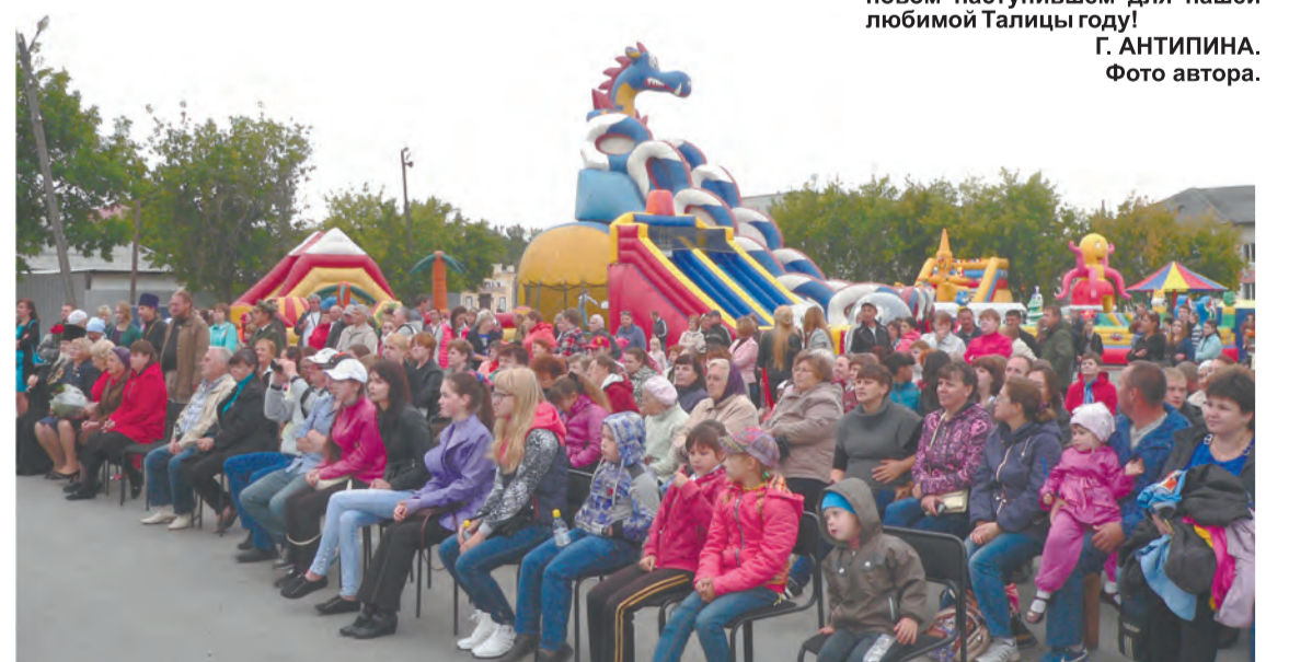
Концертная программа порадовала всех!

На экране сцены появляются портреты Почетных граждан Талицкого городского округа – они в различные годы поднимали, защищали, прославляли Талицу: Н. И.