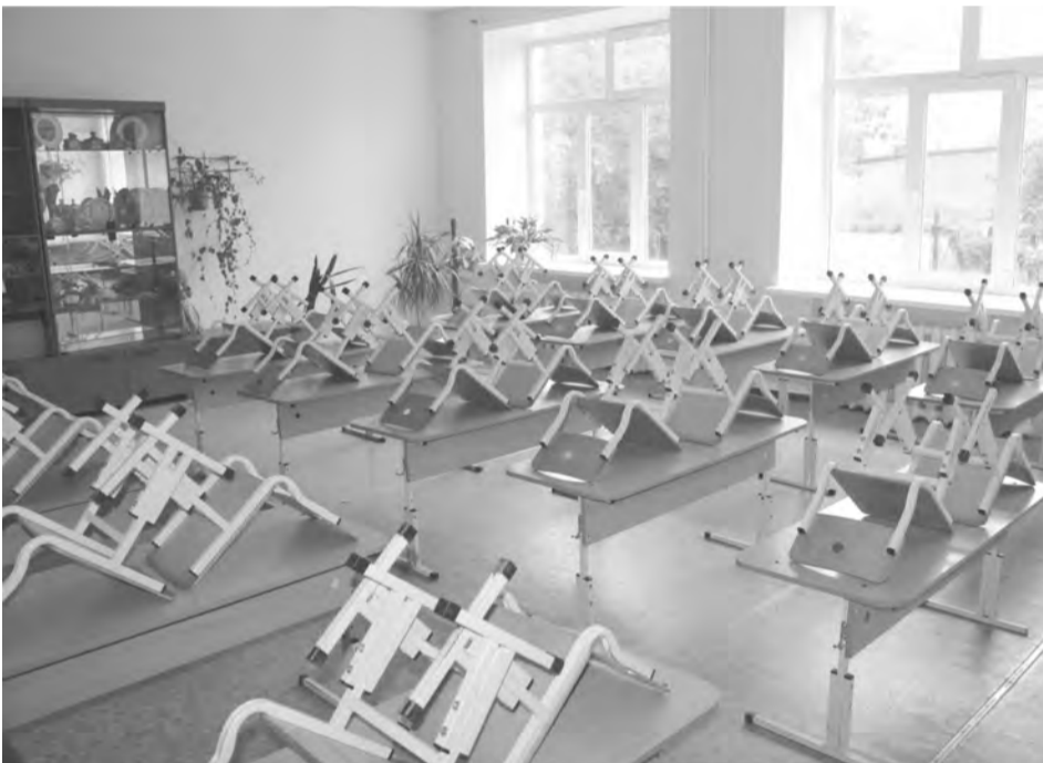
Классы ждут учеников