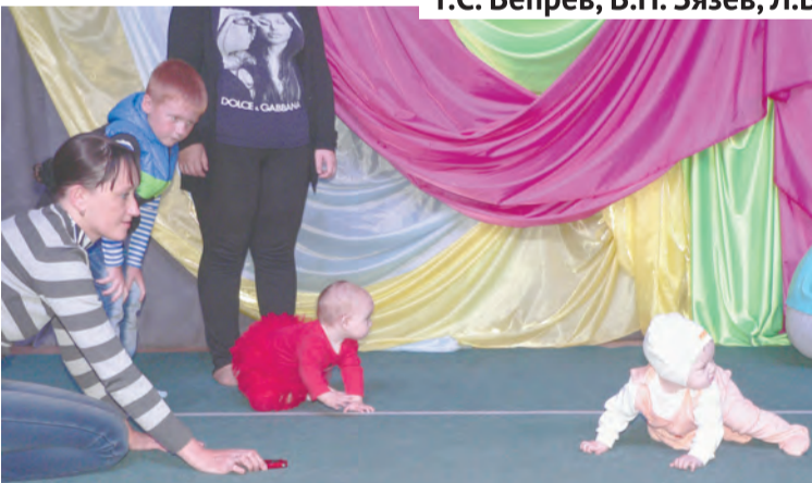
Куда ползти-то, к маме или в-о-о-н к той игрушке?!

На сцену поднимаются Почетные граждане г. Талицы, их приветствуют аплодисментами, благодарят за труд во имя своей малой