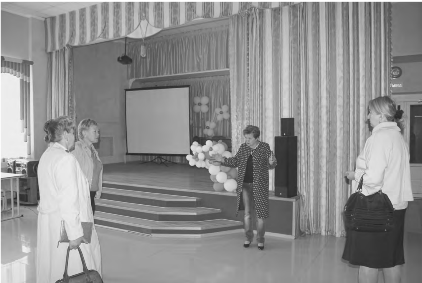
Члены приёмной комиссии в актовом зале школы №1