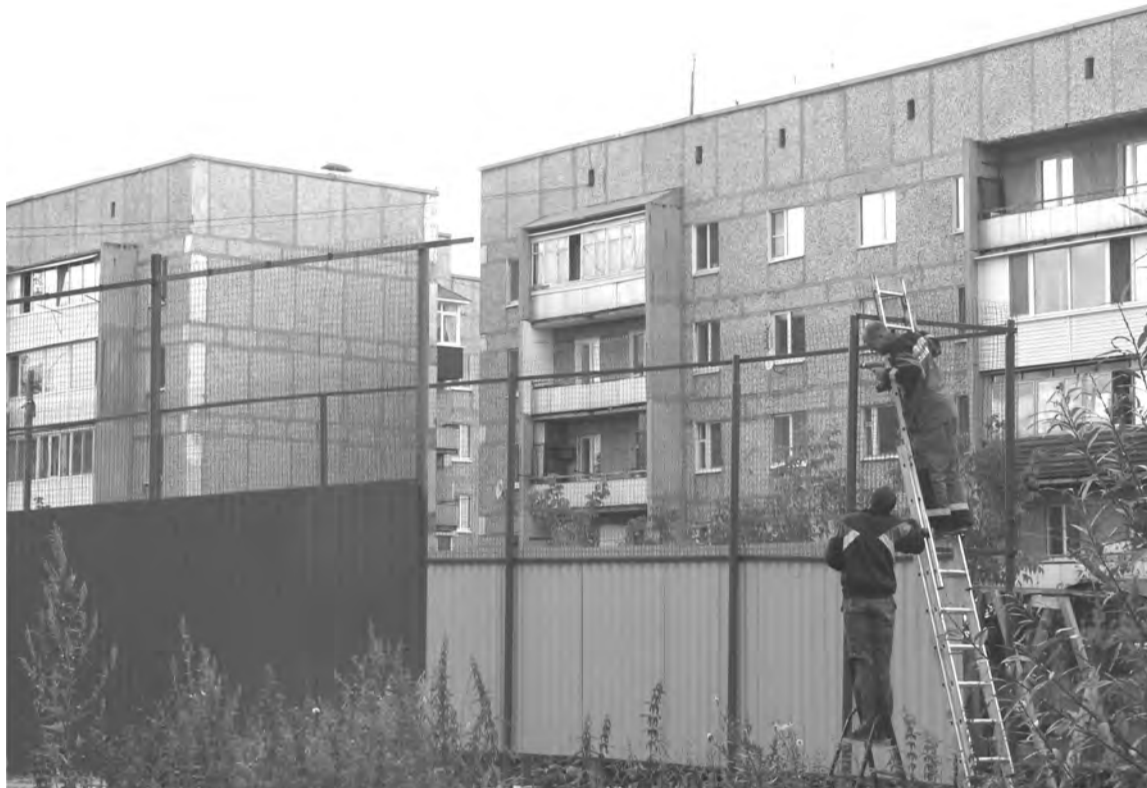
- Вот теперь мусор не раздует и на площадку приятно зайти (Рябиновая, 6)