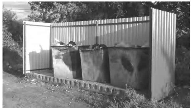
Обустроили площадку и по ул. Кузнецова, 9, 11 (п.Троицкий)