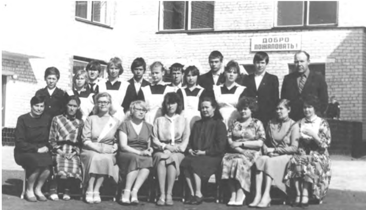
Первые выпускники Вихляевской средней школы с учителями

За 30 лет 445 выпускников получили в стенах нашей школы знания