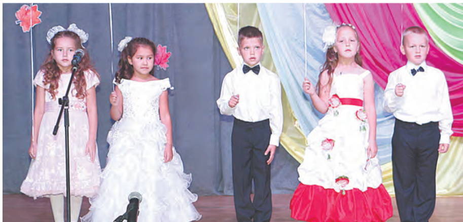
Воспитанники детского сада №2 «Солнышко»

После своего выступления А.Г.Толкачев вместе с начальником управления образования ТГО И.Б.Плотниковой вручили благодарственные письма главы ТГО педагогам образовательных организаций, которые в летнее время продолжали работать с детьми. Под аплодисменты