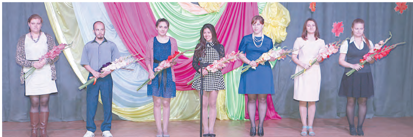
Наша надежда - молодые специалисты

Педагоги района подвели итоги и наметили планы на будущее