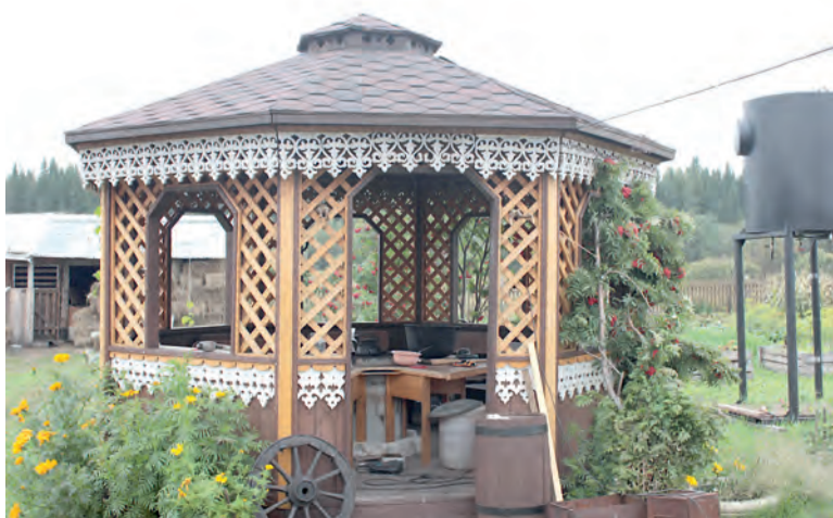
Рукотворная беседка во дворе