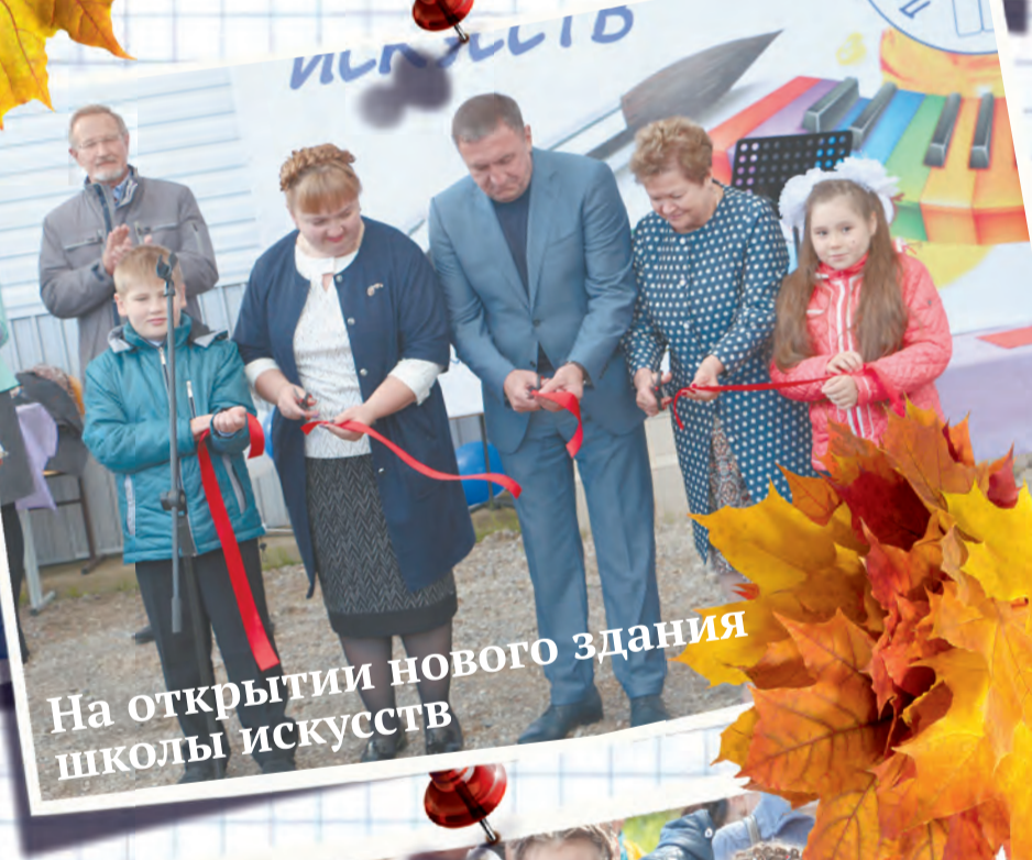
На открытии нового здания школы искусств