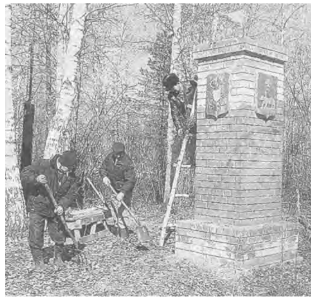
Сегодня пограничный столб выглядит так