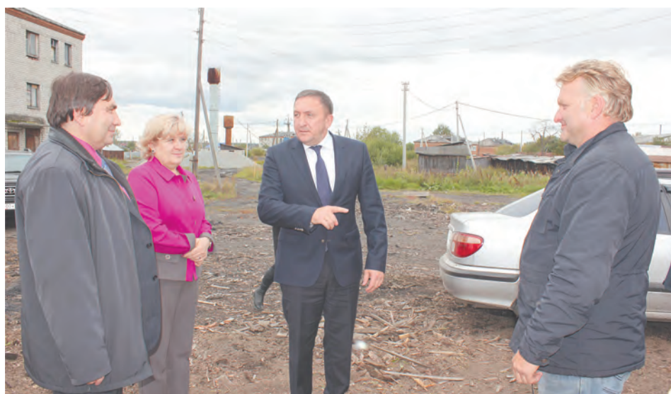
«Ревизия» котельной в п. Троицком, ул. Луговая