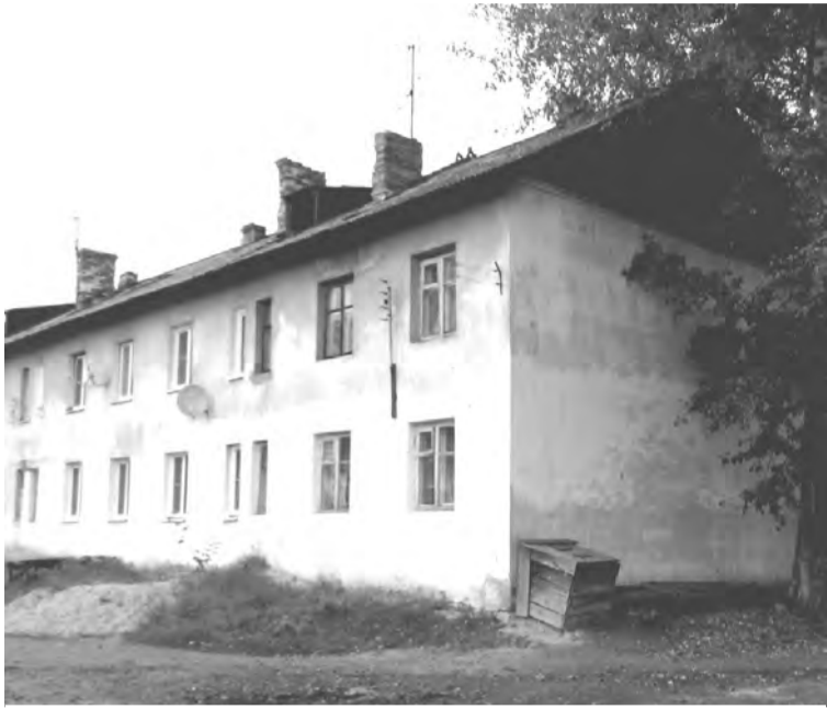
ул. Карла Маркса, 24

«От нашего дома отказываются все коммунальные компании...»