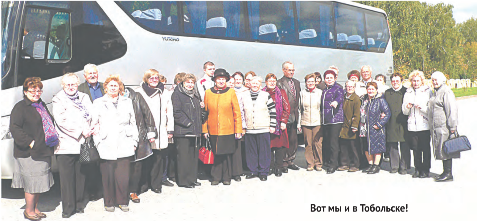
Вот мы и в Тобольске!

Началась наша экскурсия с верхней части города, по которой проходил земляной вал, потому что старинное кладбище, здесь распо-