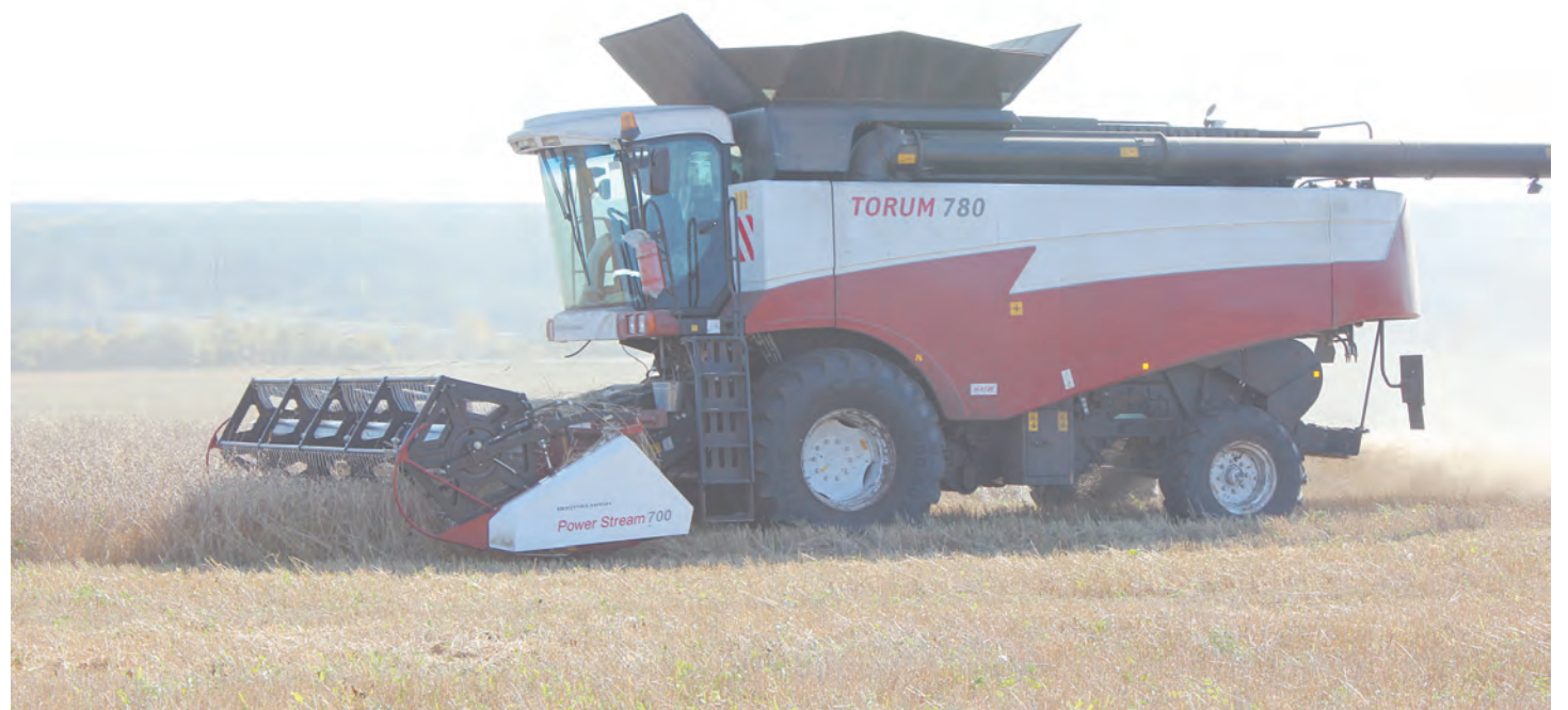
Новый комбайн «Торум 780»

Как рассказали в министерстве АПК и продовольствия Свердловской области в регионе зерновые и зернобобовые культуры убраны на 40,4 процента посевных площадей, что превышает уровень прошлого года на 15 процентов. Валовый сбор зерна составил 280,5 тысячи тонн в первоначальном виде, что превышает прошлогодний уровень на 30 процентов. Несмотря на сложные погодные условия темпы уборки зерновых выше, чем в прошлом году.