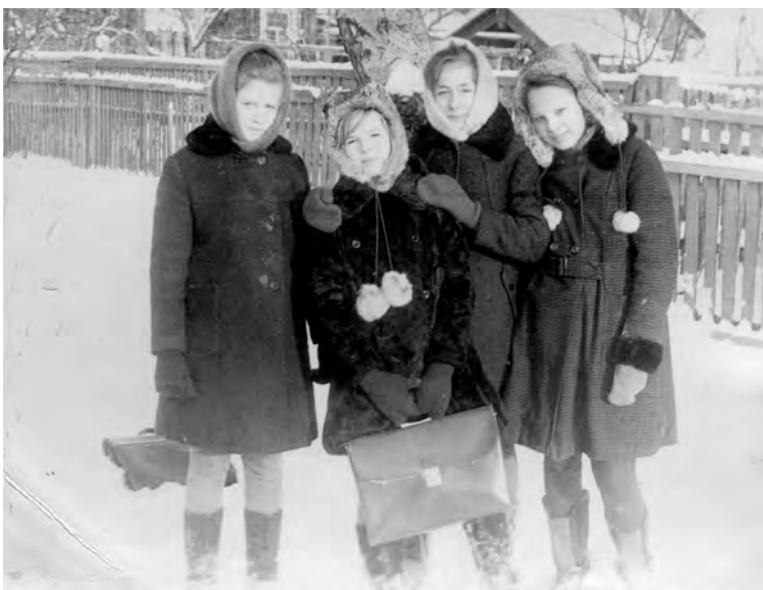
После уроков... 6-а класс. 1975 г. Троицкая школа № 5.

Присылайте фото на конкурс по адресу редакции: Талица, Ленина, 88, редакция газеты «Сельская новь», фотоконкурс «Одноклассники». Снимки принимаются и по электронной почте редакции gazeta-sn@mail.ru.