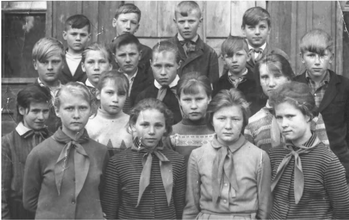
Ученики Чупинской средней школы, 6 «а» класс. 1965 год.