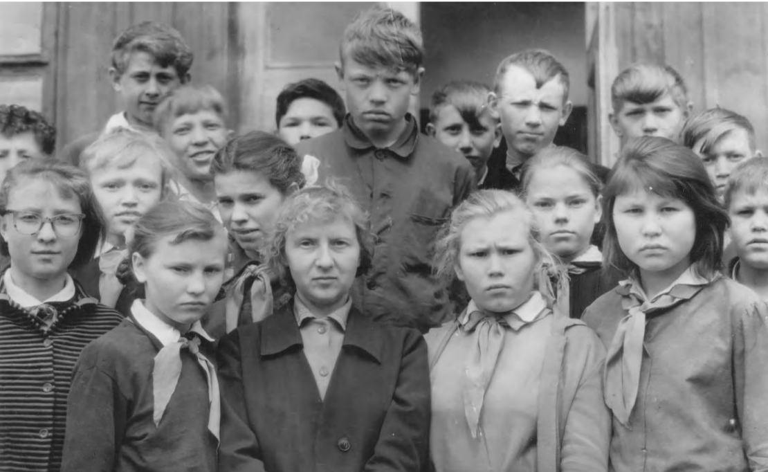
Ученики Чупинской средней школы, 6 «б» класс. 1965 год.