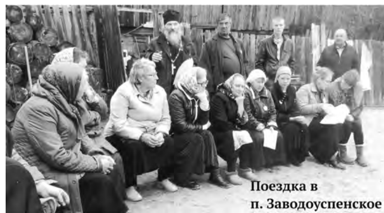
Поездка в п. Заводоуспенское

Общество «Трезвение» при храме святых первоверховных апостолов Петра и Павла продолжает свою работу.