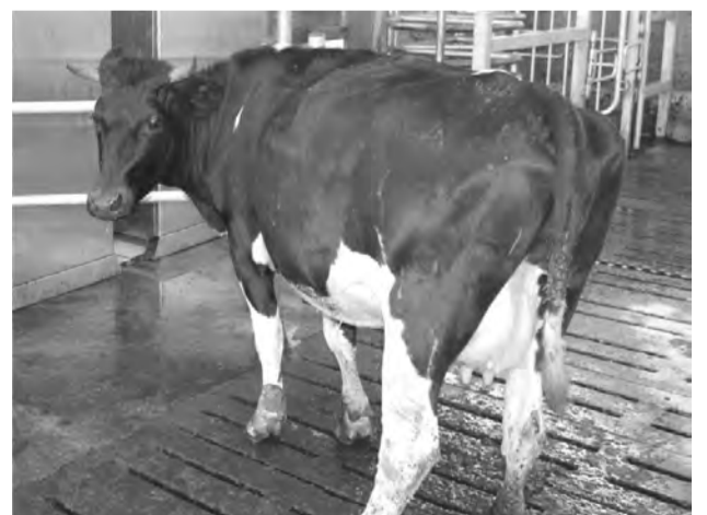
На ферме ПСК «Колос»

Накануне профессионального праздника выражаю