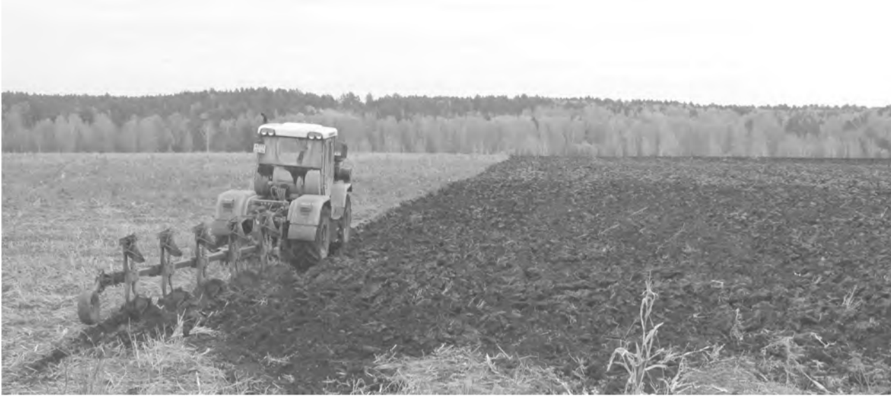
Идет вспашка зяби в СПК «Заря»

Где поставит запятую? Ответить на этот вопрос не возьмётся сегодня никто. На календаре преддверье зимы, а на сегодняшний день остаются необработанными порядка 13% зернового клина (3 851 гектар).