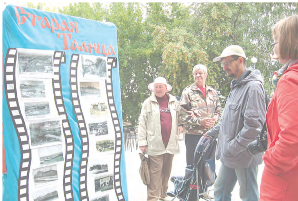
Выставка в сквере Н. И. Кузнецова

Благодаря выигранному гранту в размере 258 200 рублей, появится возможность