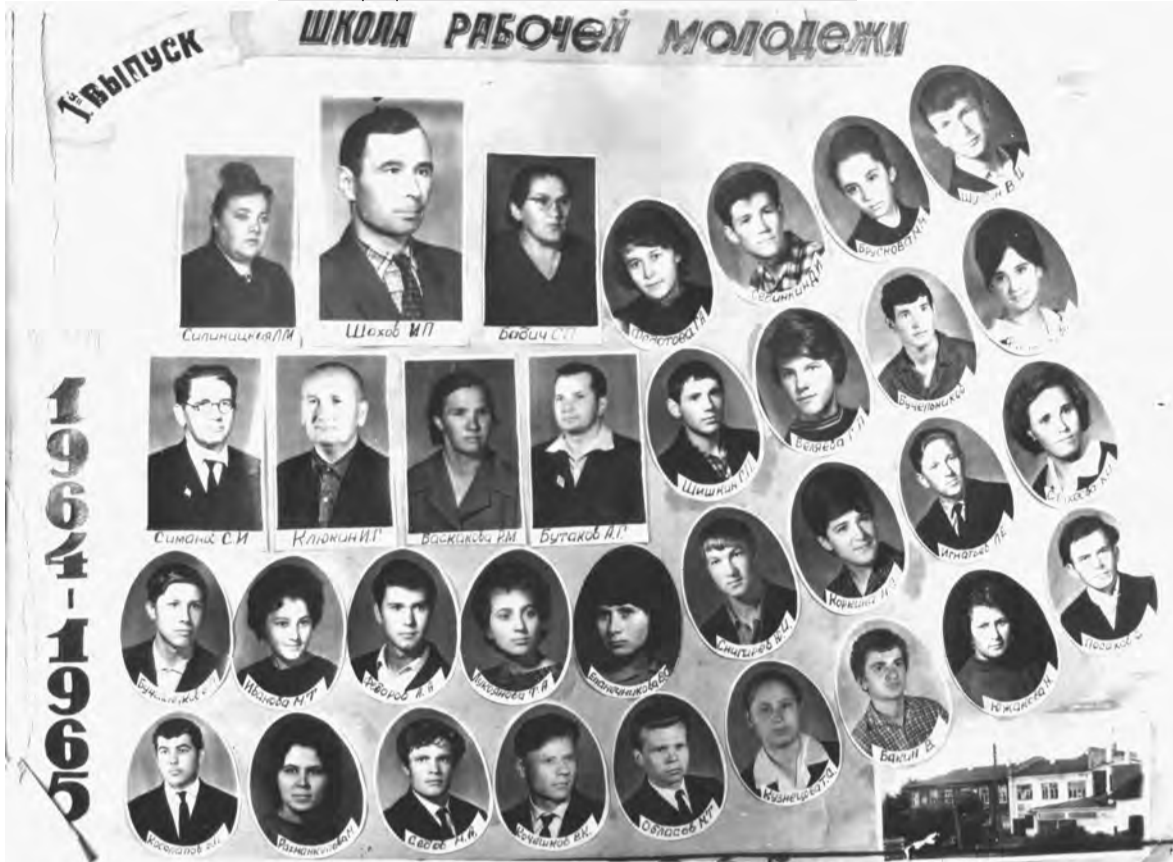
1-й выпуск школы рабочей молодежи. 1964-1965 г.