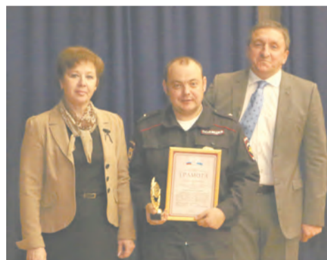
Вручение Диплома «Честь и достоинство»

результатов нашей работы. Мы хорошо понимаем, что в основе такого доверия людей прежде всего уверенность. А она не приходит