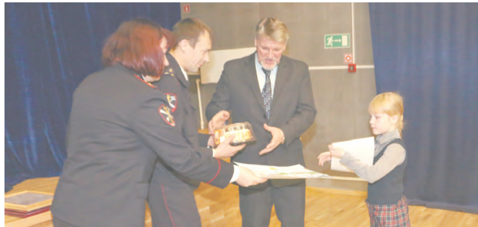
К грамоте полагался и сладкий приз

результатов нашей работы. Мы хорошо понимаем, что в основе такого доверия людей прежде всего уверенность. А она не приходит