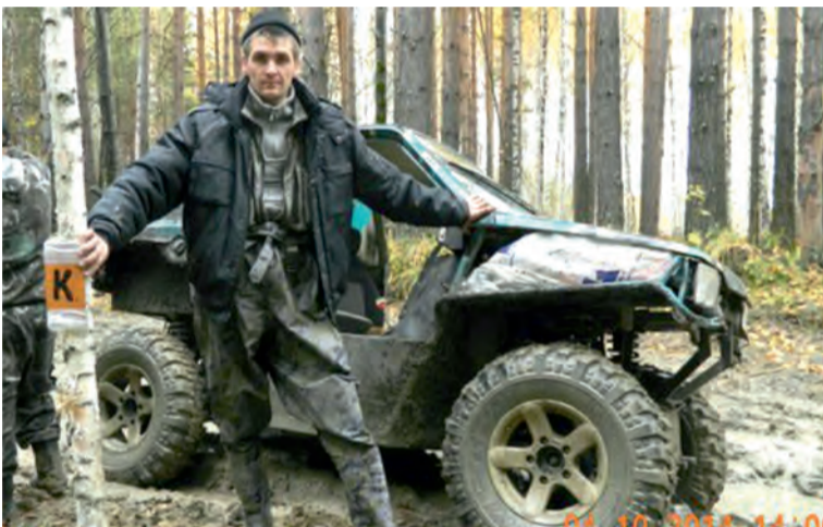
На соревнованиях Талтрофи

Общаясь с молодой семьей, я поняла, что этими увлечениями в семье дело не ограничивается. В их квартире красуются чучела различных зверей, которые