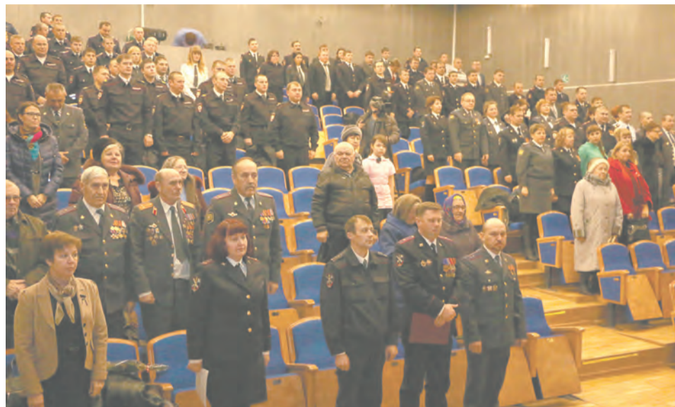
Минута молчания по погибшим при исполнении коллегам

В РИКДЦ «Юбилейный» состоялось торжественное собрание, посвященное Дню сотрудника органов внутренних дел