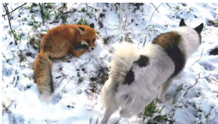
На расстоянии вытянутой руки с опасным зверем