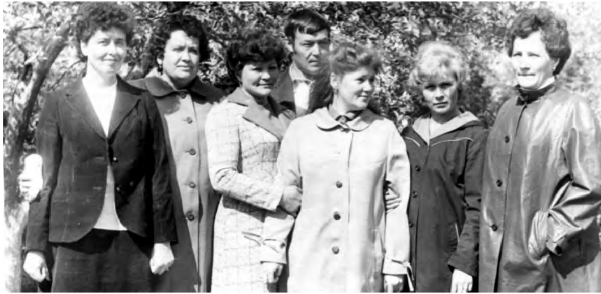
20 лет после окончания Пионерской школы. 1986 г.

В № 44 от 5.11.15 г. в комментарии к фотографии «Четверка дружных и их тренер допущена опечатка. Вместо 1975 года нужно читать 1965 год.