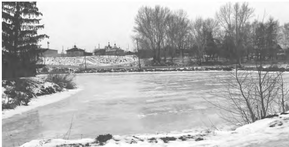
Пруд в д.Мохиревой, где удалось избежать беды

Для настоящих героев возраста не существует.