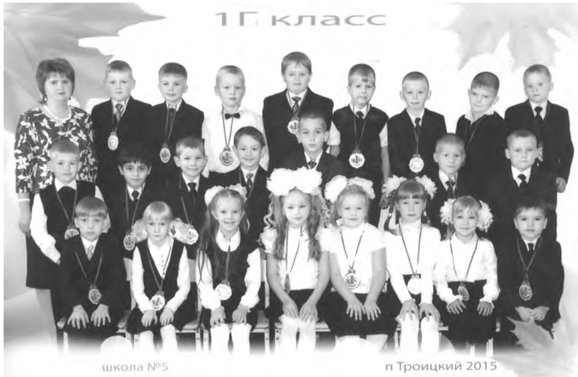
Перед вами будущее нашей страны. Первоклассники 1 «г» класса школы № 5. 1.09.2015 г.