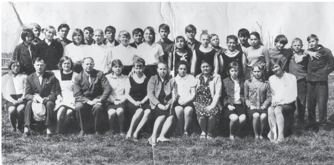
1970 год. Горбуновская школа. 8 класс.