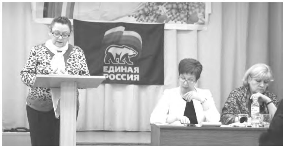
Обсуждение отчетного доклада

- Жилищно-коммунальное хозяйство. Всегда и во все времена не только большая головная боль для руководителей территории, но и для жителей.