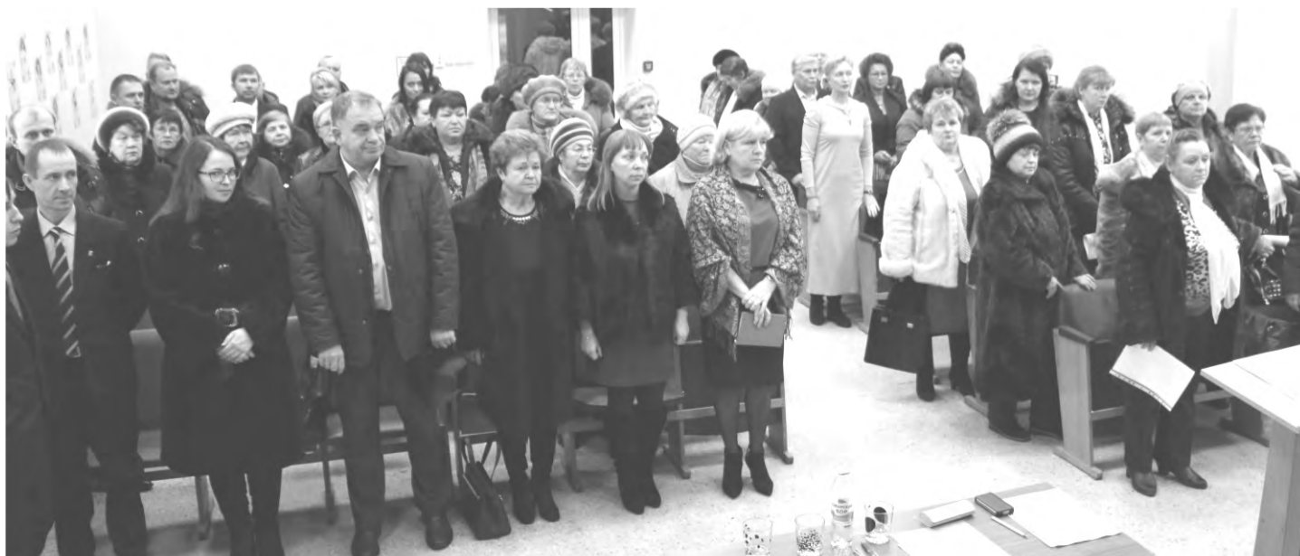
Открытие отчетной конференции Талицкого МО Партии «Единая Россия»