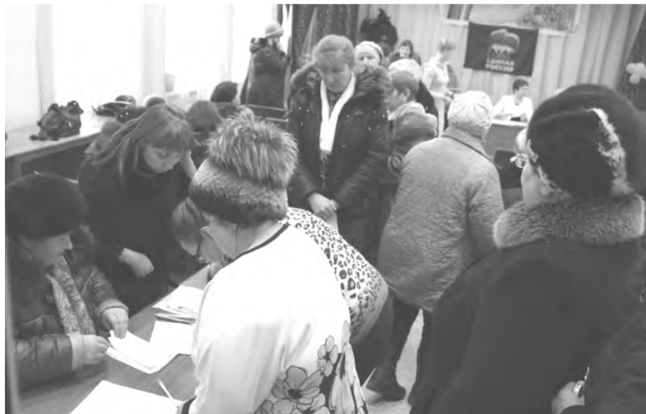
Регистрация делегатов конференции