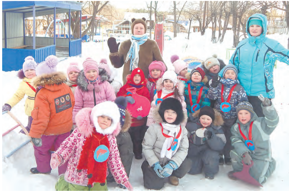
Малые олимпийские игры в детском саду «Теремок»

«На территории Мохирёвской управы «Лыжня России» проходила на базе Беляковской школы, - написала нам Т. Третьякова. - Набралось более 70