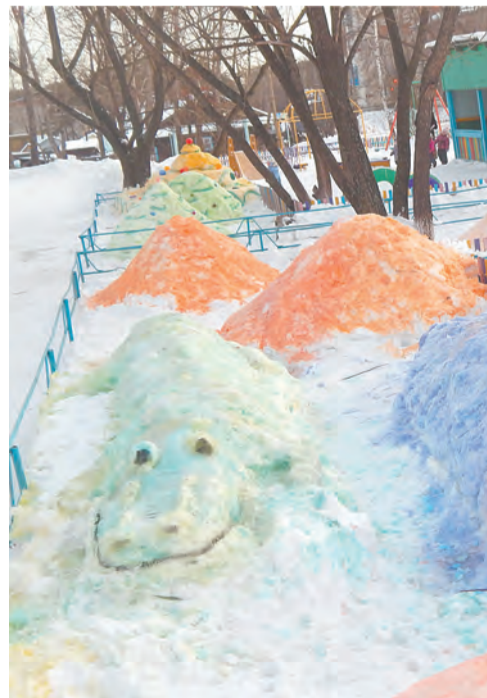
Зимнее оформление участков в д/с «Теремок»