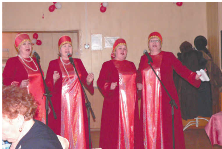
Ансамбль «Желанушки» стал, действительно, желанным...