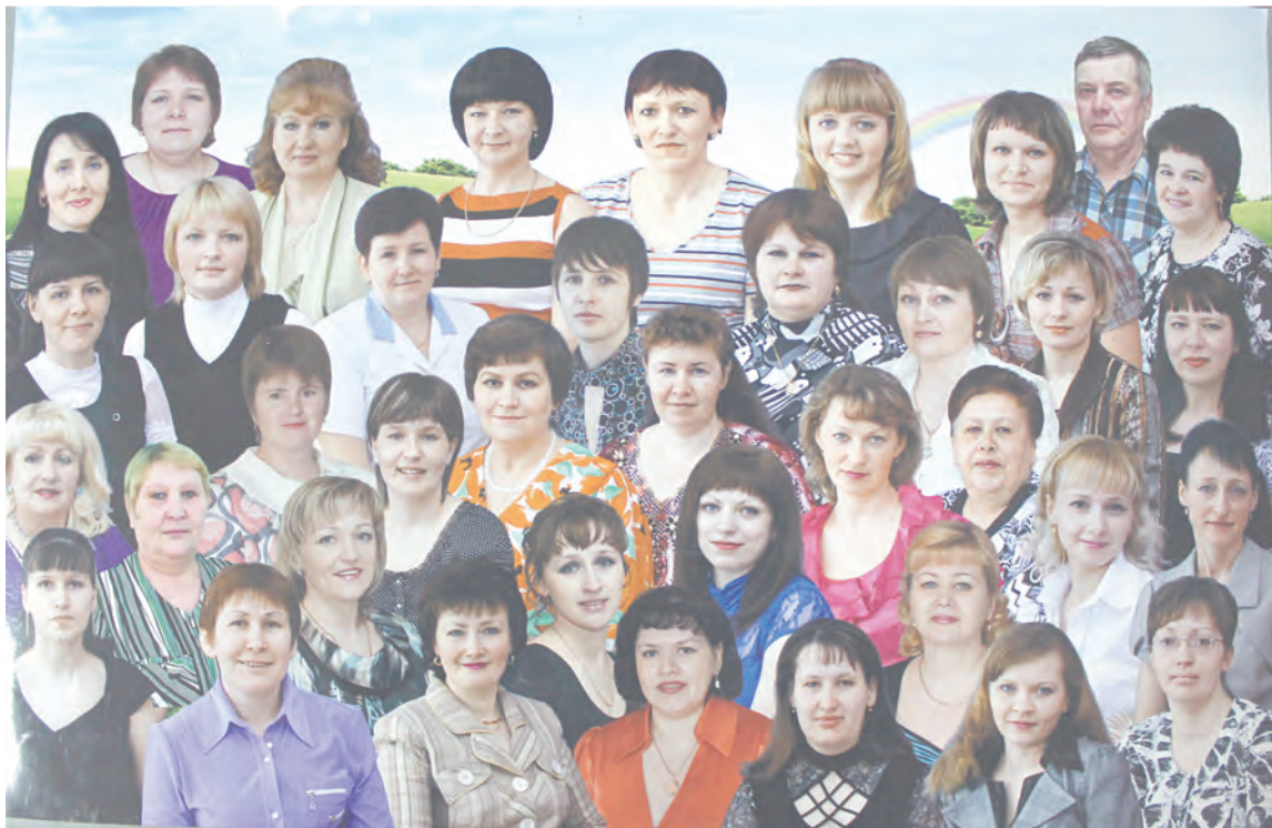
Коллектив детского сада

Один из лучших детских садов в Талицком городском округе отмечает 55-летний юбилей