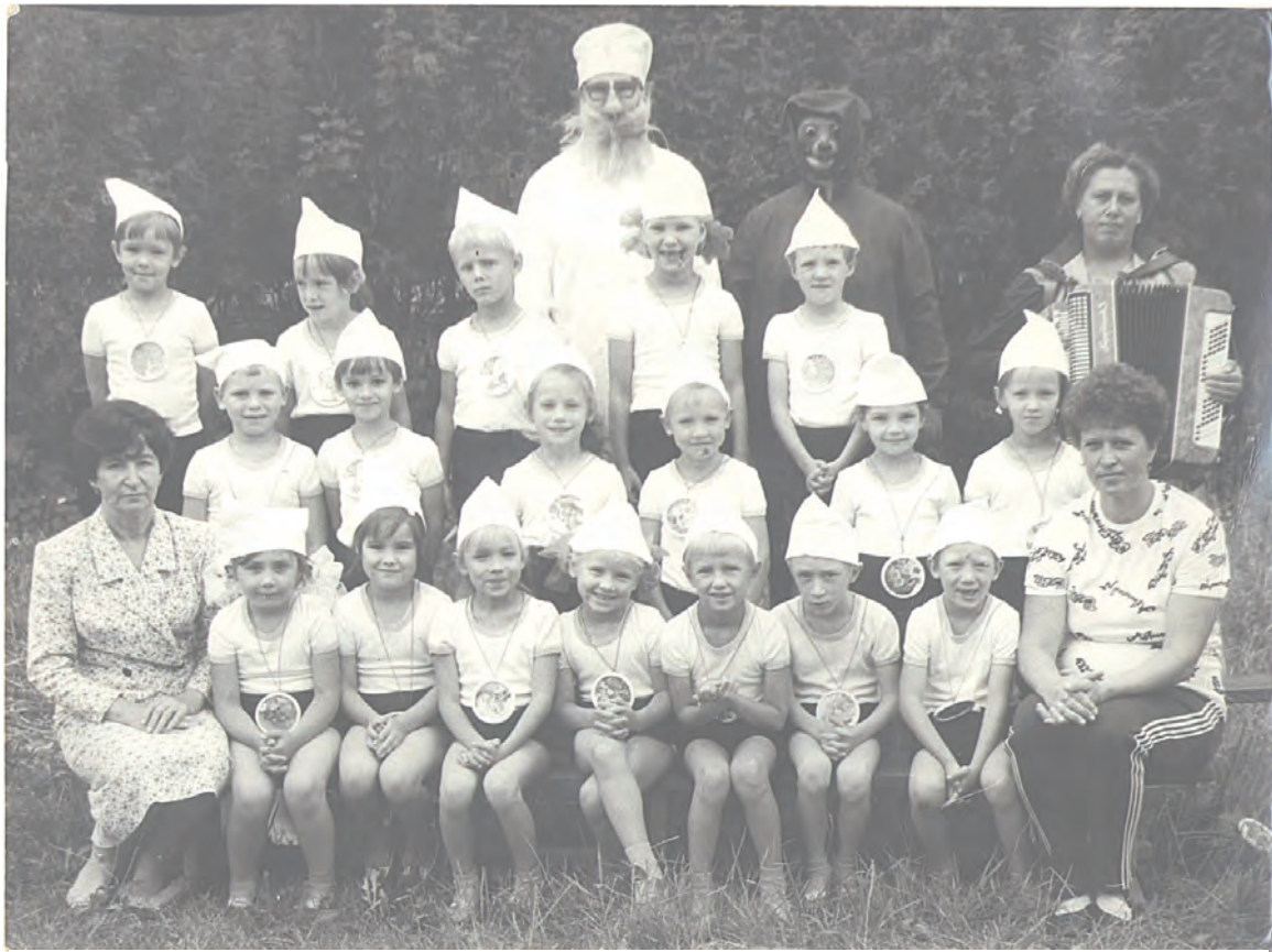
Группа детского сада 80-х годов

Наш рассказ об этом детском саде и его юбилейном дне рождения выходит в первом номере газеты этого года. Позади новогодняя ночь, впереди