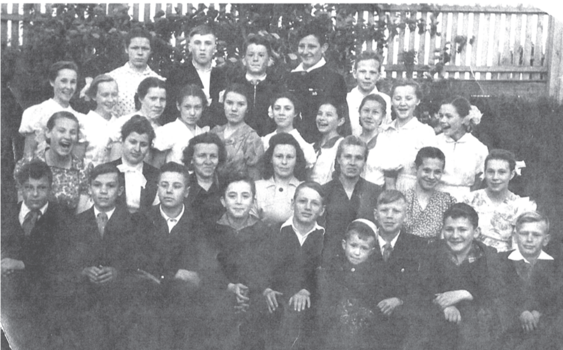
Школа № 1, 7а класс. г. Талица, 1961 г.