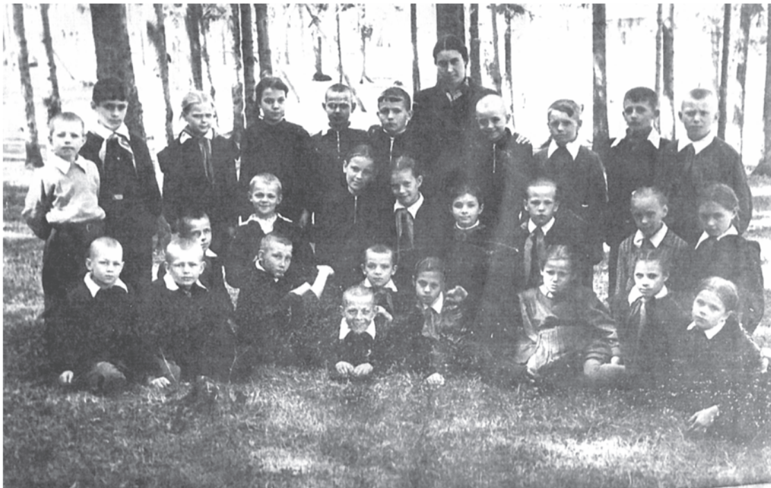
Школа № 1, 3 класс. г. Талица, 1956-1957 г.г.