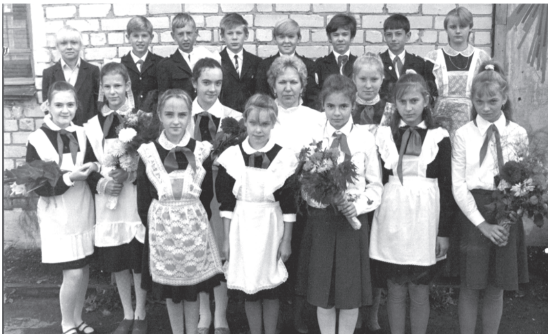
Ученики школы № 8. 1986-1987 годы.