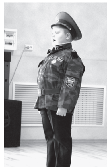
встречи ветеранов и школьников, совместно работали директора, педагоги-организаторы школ, члены первичных ветеранских организаций.