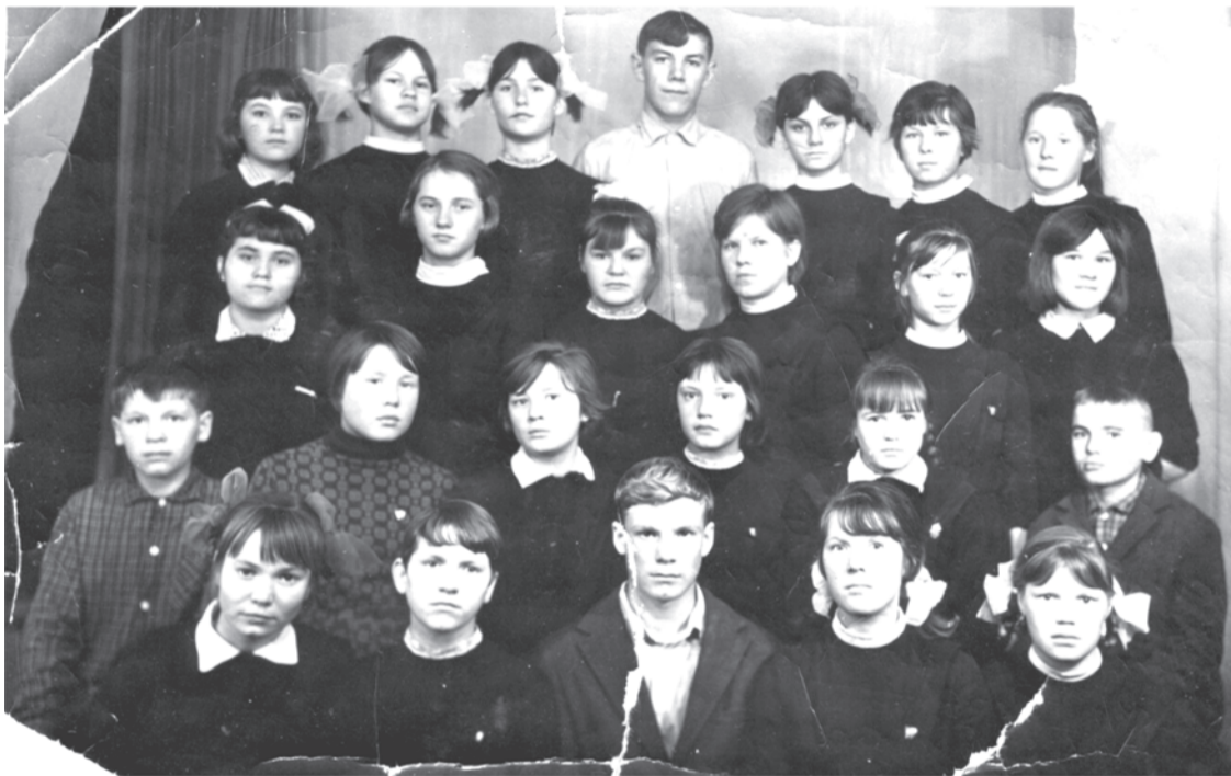
1969 год. Ученики школы-интерната, 8 класс. Школа -интернат. г. Талица.