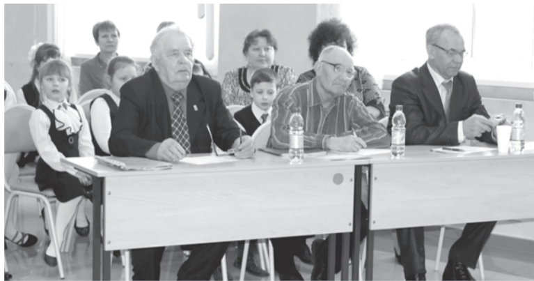
Участниками данного мероприятия являются образовательные учреждения ТГО и граждане, входящие в категорию «Дети войны».

В Талицком городском округе районным Советом ветеранов и поэтическим клубом «Светлые ключи» в 2016 году объявлена ветеранская акция «Дети войны», посвященная 75-летней годовщине начала Великой Отечественной войны.