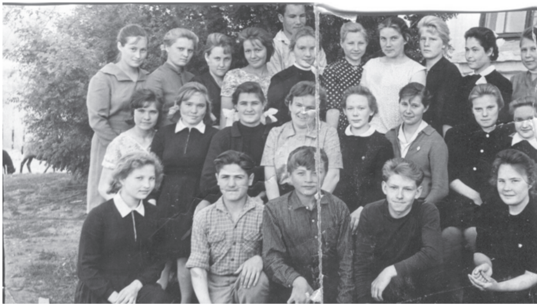
Буткинская средняя школа. 1963-1964 год.