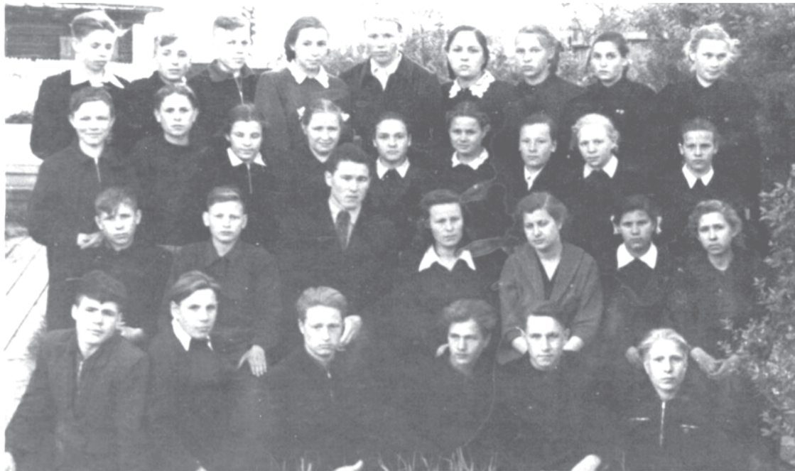
Школа № 1, 8 «г» класс. 1958 г. Кл. руководитель Ситларов З.А. Преподаватель русского языка и литературы Михнова И. А. (во втором ряду, третья справа).