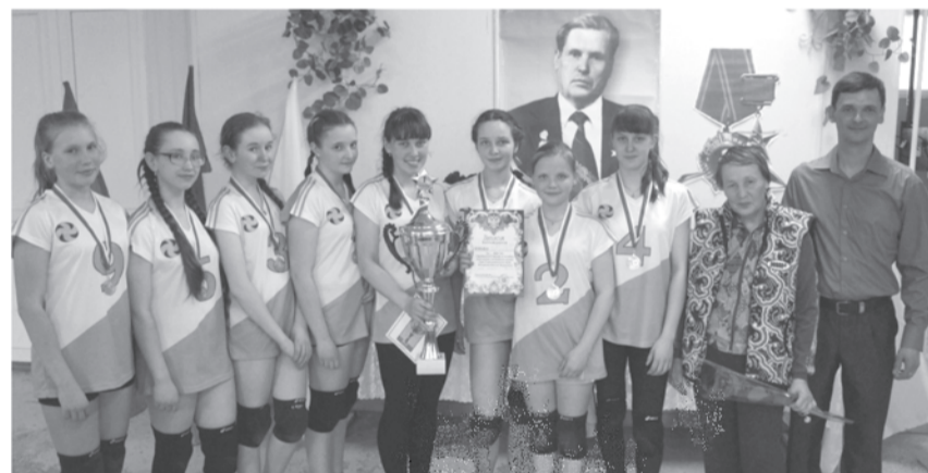
Обладатели кубка им. Малышкина

14 апреля состоялось заседание Совета ветеранов Талицкого городского округа. Столь представительное собрание созывается не реже двух раз в год или по особо важным вопросам.