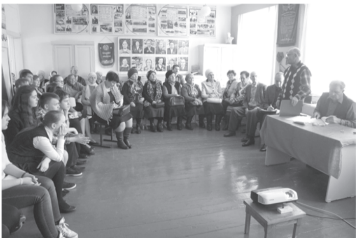
Рабочая встреча в Пионерской школе