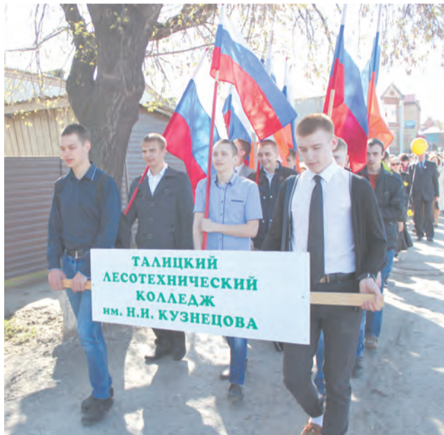
Шествие праздничной колонны